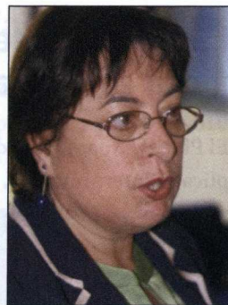
Olaia Fernández Davila. Diputada del BNG en el Congreso.

L a posición de la pesca gallega a nivel mundial es un hecho indiscutible, situada en los primeros puestos del ranking, pero cada vez más acorralada por las decisiones internacionales y de la UE sobre recortes pesqueros. Decisiones que paulatinamente provocan el adelgazamiento de nuestro sector pesquero a pesar del esfuerzo que ha realizado en aras a su modernización y adaptación tecnológica. Desde luego, no será el BNG quien discuta la necesidad de recuperar los stocks de determinadas especies debido a la sobreexplotación de caladeros. Ciertamente se necesitan planes de recuperación pero, cierto también que se precisan estudios serios de la situación de las zonas de pesca que obedezcan a criterios objetivos y científicos. Y esa documentación es algo que nosotros y el mismo sector echó en falta en numerosas ocasiones en las que se decidió el cierre de los caladeros.