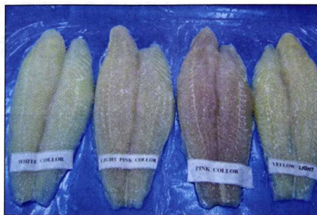
Filetes de panga en un punto de venta.

En la última de las notas enviadas a la dirección de Pesca comunitaria ARVI expresa, a través de la Asociación de Empresas Comunitarias en Sociedades Mixtas de Pesca (ACEMIX), que crece la preocupación por las importaciones de panga, procedentes de varios países asiáticos, Vietnam, China, Corea y Tailandia entre ellos. Informaciones y datos si-