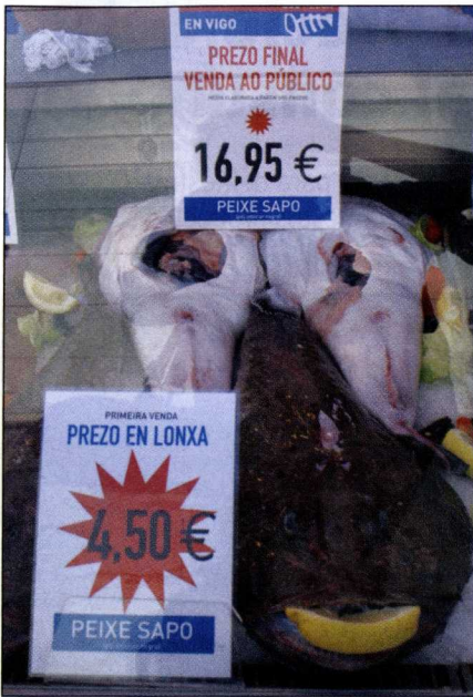
Cada pieza lucía dos etiquetas: una con el precio de venta en lonja y otra con el precio de venta final que paga el consumidor.

productores quisieron evidenciar su preocupación ante "los márgenes abusivos" que se registran en