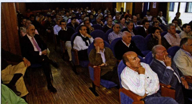
La Asamblea de la Cooperativa de Armadores de Vigo, reunida para aprobar el calendario de movilizaciones.