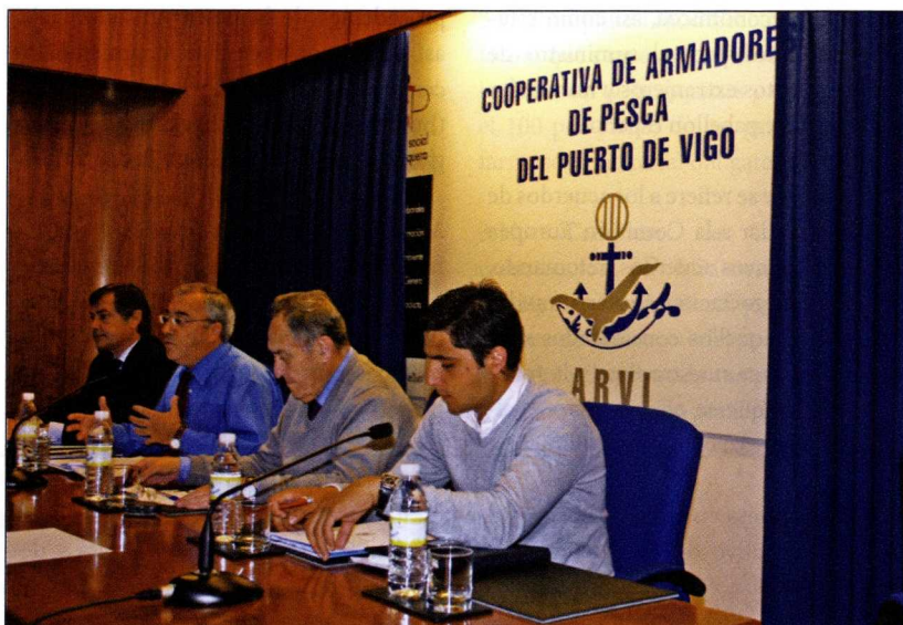
Los responsables de ARVI explican el Plan de Viabilidad a los asociados.

Lejos los tiempos en los que la Administración española promovió el movimiento conocido como los "Países Amigos de la Pesca", en esta ocasión ha sido el Gobierno francés el que, con sus iniciativas, ha liderado el apoyo de las flotas de los Estados europeos en los que la pesca es un sector estratégico. Un miembro del gabinete de Sarkozy se reunió con representantes del sector de Francia, España, Italia y Bélgica y buscó apoyos en el Reino Unido y Dinamarca. El objetivo es lograr una estrategia de presión ante la Unión Europea para que se establezcan mecanismos de apoyo a la flota. Al mismo tiempo, en España, la patronal CEPESCA esperaba, en el momento de cerrar esta edición, una respuesta de la ministra Espinosa a su petición del 15 de abril para mantener un encuentro.