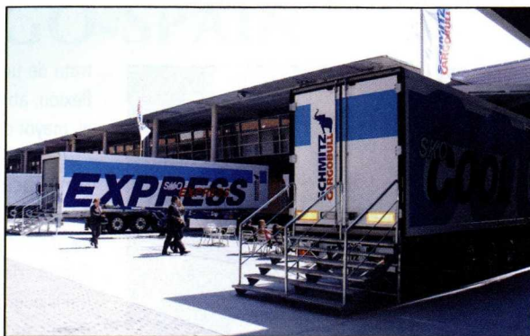
En diez años de vida, SIL se ha convertido en referente mundial.

La segunda jornada del 60 Forum Mediterráneo servirá para conocer más de cerca el estado de las inversiones y de la gestión de las infraestructuras portuarias de la