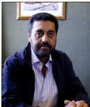
El presidente de la Autoridad Portuaria de Vigo, Jesús Paz.

Esta nueva línea de atraque del Berbés, que duplica a la actual, estará protegida por otra ampliación muy importante que está prevista en Bouzas para el tráfico rodado,