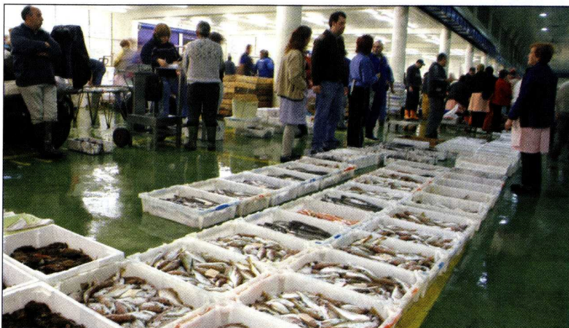
Especies de pesca de baja en la lonja de Vigo, a la espera de ser subastadas.

answers. With a budget in line with demands regarding resource management, the economic development of the sector, crew and safety, tabled by its own fishermen and which, in general lines, are similar to those expressed by the community industry as a whole. Among other realistic aspects, this plan includes 100% social tax exemption for the producers, up to December of this year. These measures, to a degree, define just how far it is possible to go when there is a firm political willingness to back an activity, in this case fishing, with economic stimuli and backing similar to those available to other sectors in the economy that are considered to be strategic.