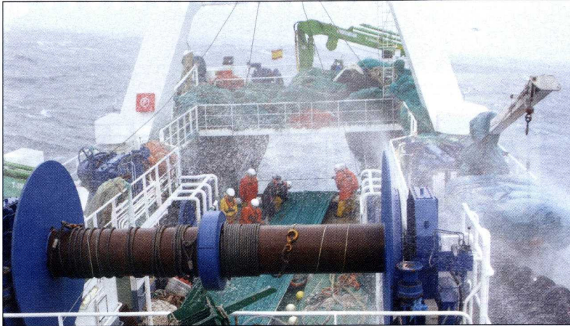
Faena de pesca con mal tiempo.

“minimis” concedidas por la Administración para hacer frente a la alta incidencia del precio del combustible en los costes de explotación. De esa cifra, unos 10 millones de euros han sido asignados a Galicia. Como se recordará, esos “minimis”, de un máximo de 30.000 euros por beneficiario, fueron en su día autorizados por la Comisión Europea.