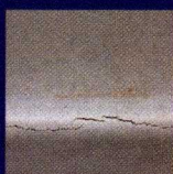
Cuarateamientos en un tanque de lastre tratado con un producto epoxi convencional