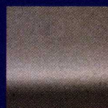
Ausencia de cuarteamientos en un tanque de lastre tratado con Hempadur Fibre 4760