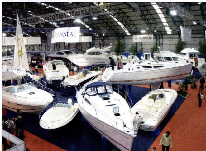
Las últimas novedades de la náutica deportiva se exhiben en IFEVI