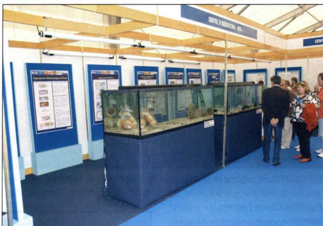
Fotografías de la anterior edición de EXPORÀPITA, que fue la primera desde que la feria tomó su carácter bienal.

ción naval y embarcaciones acuícolas; equipos propulsores y de maniobra; equipos auxiliares de máquinas; electrónica y electricidad naval; equipos de cubierta; equipos y elementos del casco, arboladura y jarcia; habilitación; equipos de pesca y acuicultura; otros equipos, materiales y servicios; embarcaciones de recreo y náutica deportiva; acuicultura: instalaciones flotantes, alimentos, filtración, redes...; transformación y manipulación de productos; prensa especializada; instituciones.