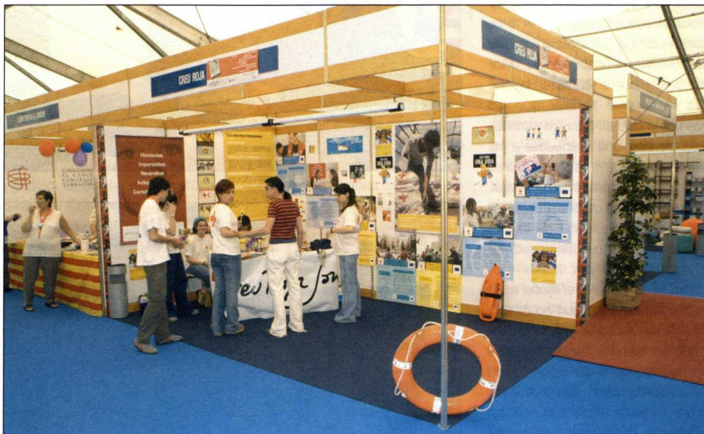
EXPORÀPITA se celebra en la población de Sant Carles de la Ràpita, un puerto principal de la pesca en Cataluña.

Tendrá lugar entre los días 28 de abril y 1 de mayo en San Carles de la Ràpita (Tarragona) y presentará como novedad una mayor atención a la comercialización, la acuicultura y la náutica