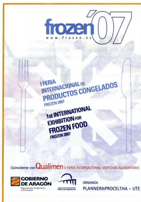
Cartel anunciador de la Frozen'07 de Zaragoza