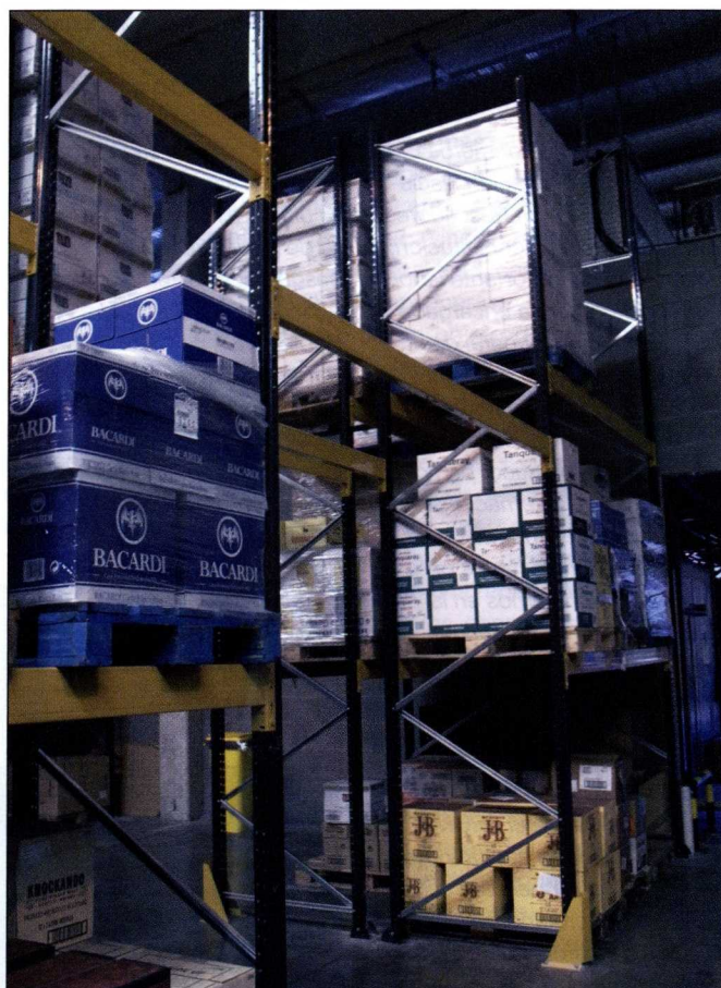
Imagen de uno de los almacenes de Elice Entrepot.

De hecho, una parte significativa de la actividad de Elice es la de enfrentarse ante una gran cantidad de papeleo y trámites, de los cuales, por supuesto, se libera al armador. Incluso, en muchos casos, al tratarse de clientes de larga duración la empresa ya conoce los gustos y necesidades, ahorrándole también buena parte del esfuerzo al armador. La particularidad de esta empresa es que suministra artículos "entrepot", es decir, sin impues-