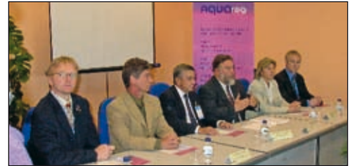
Imagen de una actividad paralela en Conxemar.

La octava edición de CONXEMAR volverá a contar con el ya casi tradicional Meeting Point que organiza la Cámara de Comercio de Vigo y que, a su vez, forma parte del Plan FOEXGA. El Meeting Point está concebido como un punto de encuen-