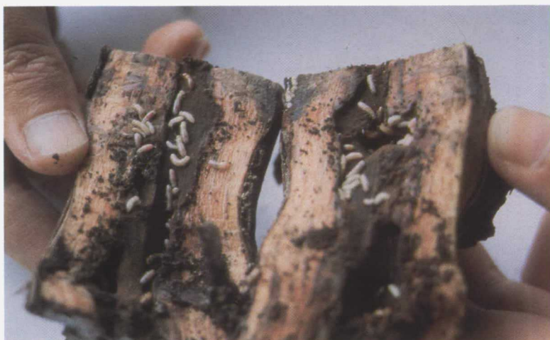
Madera de vid mostrando distintos estados larvarios de Calotermes flavicollis F.