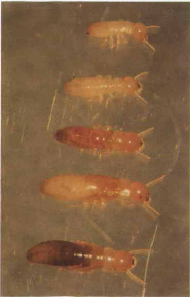
Distintos estados preimaginales de Calotermes flavicollis F.