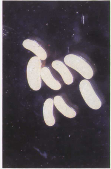
Dos tipos de huevos de Calotermes .