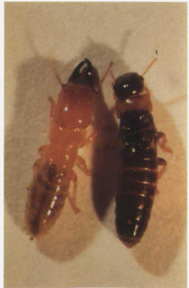
Adulto no alado (Dcha.) y Soldado (Izqd.) de Calotermes flavicollis F.