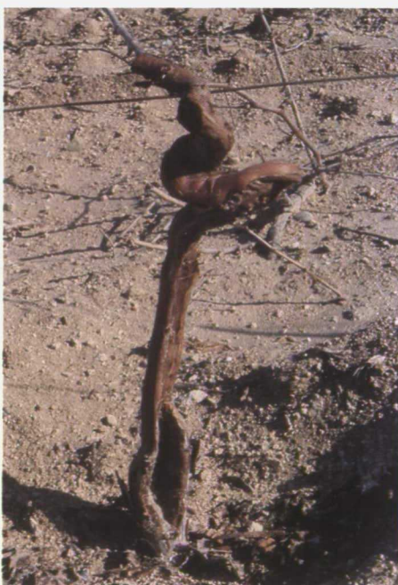
Cepa muy dañada por termitas ( Calotermes flavicollis F.).