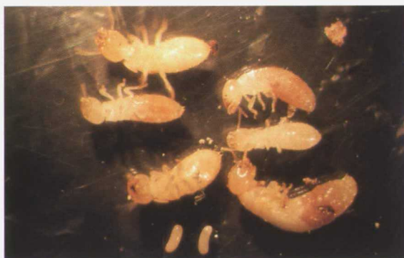
Huevos y distintos estados evolutivos preimaginales que se pueden observar en un termitero de Calotermes flavicollis F.