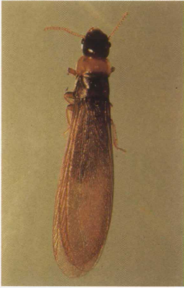
Adulto alado de Calotermes flavicollis F.