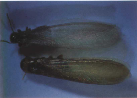
Adulto de Calotermes flavicollis F. (superior), y Reticulitermes lucifugus Rossi (inferior).