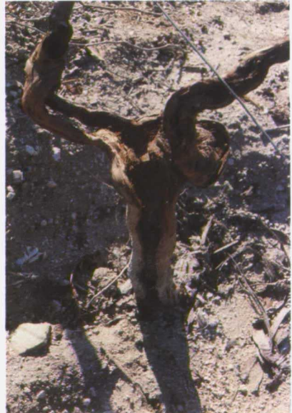
Cepa muy afectada por termitas ( Calotermes flavicollis F.).