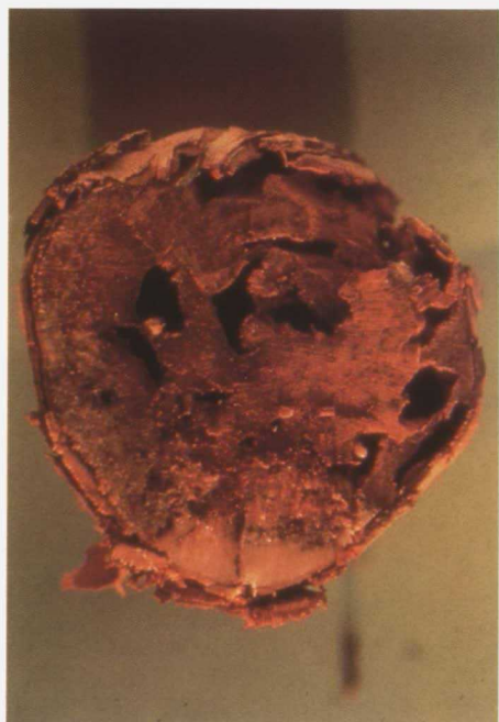
Brazo de la cepa que se rompe con facilidad por el ataque de las termitas ( Calotermes flavicollis F.).