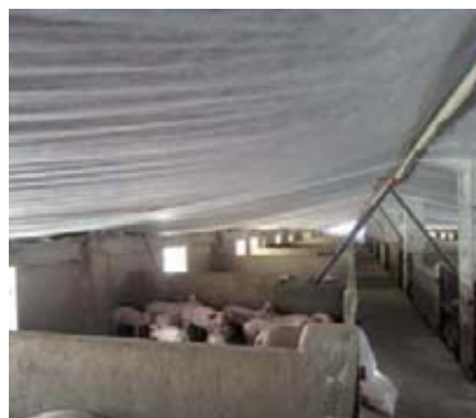
Foto 1. Manta térmica instalada en una nave.

descomposición de la materia orgánica por la enzima ureasa, que transforma la urea en amoníaco (contaminante con un fuerte poder irritante sobre las mucosas respiratorias).