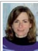
E. Creus Agrogestiic

Las zoonosis son infecciones y enfermedades que pueden transmitirse, directa o indirectamente, entre animales y humanos, por ejemplo, al consumir alimentos contaminados o por contacto con animales infectados. Entre un tercio y la mitad de todas las enfermedades infecciosas humanas tienen un origen zoonótico, es decir, son transmitidas de los animales.