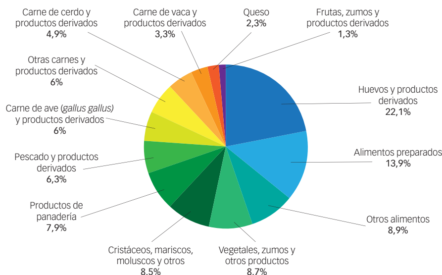
Figura 3. Distribución de los casos de toxiinfecciones en función de la fuente alimentaria en la UE, 2010.