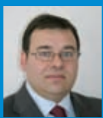
E. Pita Veterinario

En el marco de la feria ganadera Sommet de l'Élevage celebrada en Clermont-Ferrand (Francia) el pasado mes de octubre de 2011, se organizaron visitas a diferentes explotaciones típicas de la región con el fin de mostrar su forma de trabajo, así como sus peculiaridades. A continuación, se presenta la llevada a cabo en una ganadería de ovino selecto de raza Texel.