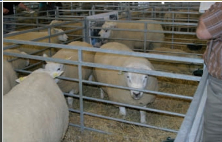
De dcha. a izqda. y de arriba hacia abajo: descartes del año, animales concursando en Sommet de l'Élevage 2011, detalle de un premio a un animal de la granja en 1999 y exposición de animales Texel en Sommet de l'Élevage 2011.