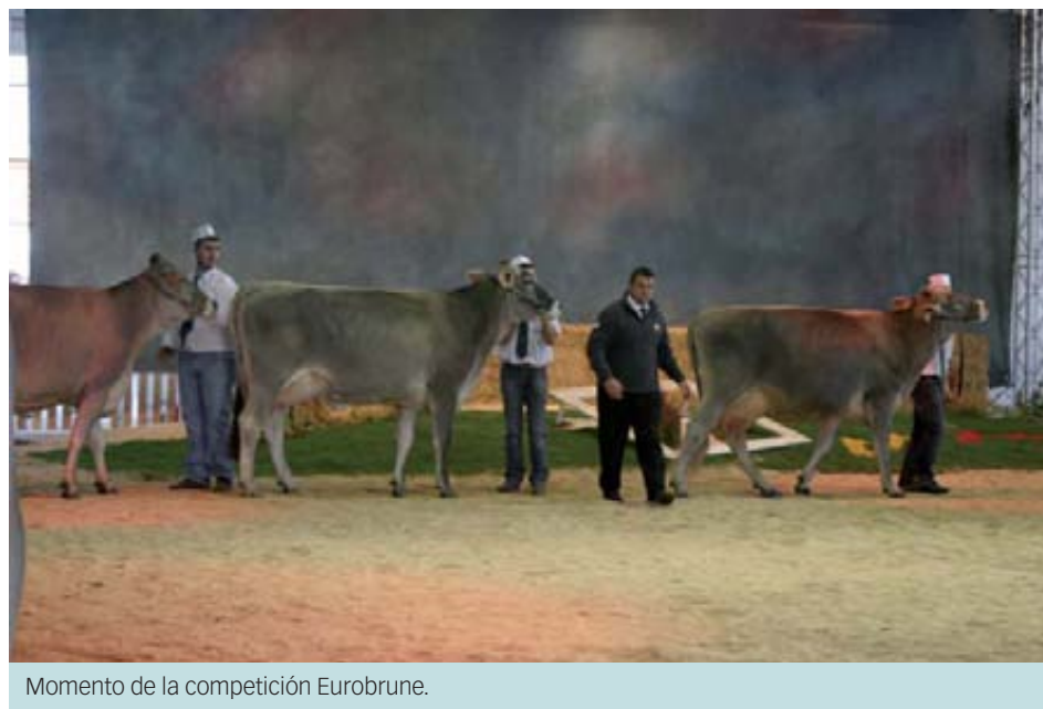
Momento de la competición Eurobrune.

de carne además de debatir el presente y futuro del sector con ponentes altamente cualificados planteando los diferentes nuevos futuros técnicos, comerciales, económicos y políticos, sin perder de vista el marco del G20 agrario y la reforma de la PAC, que moldeará y definirá el sector en la Unión Europea.