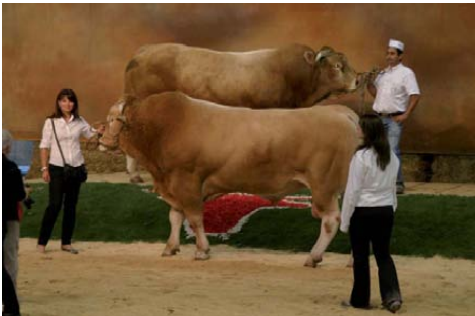
Participantes en el concurso de vacuno Limousin.

En estas conferencias se han presentado los últimos avances en términos de investigación sobre genética o calidad >>