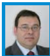
E. Pita Veterinario

Del 5 al 7 de octubre en Auvernia (Francia), se ha celebrado la tradicional cumbre ganadera de Clermont-Ferrand. Esta edición, se ha centrado más en las razas cárnicas de vacuno y ovino, con especial atención a la parte dedicada a los caballos de trabajo.