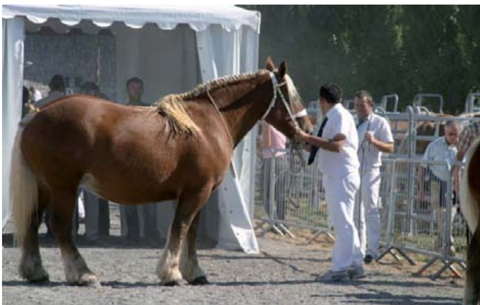
Momento del concurso de yegua Comtois.

“ Los concursos han otorgado un valor añadido a la promoción de las razas ganaderas regionales francesas ”