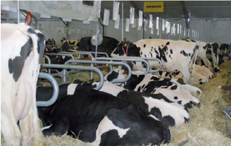
Ganado vacuno lechero de la exposición.