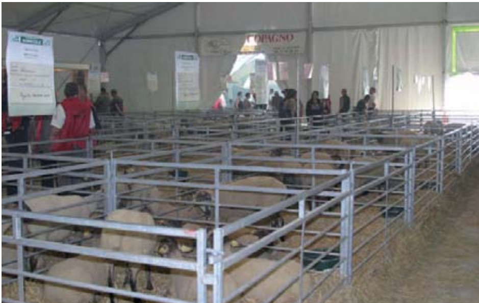
Exposición de ganado ovino.

“ Cooperativas y asociaciones ganaderas juegan un papel muy importante en la celebración y en el éxito del salón ”