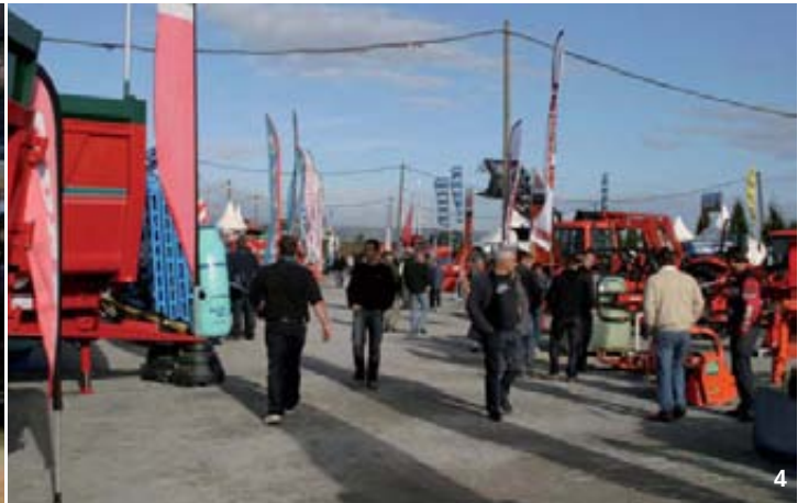
1. Fórum sobre explotaciones agrícolas. 2. Concurso de ovino Texel. 3. Concursante de Eurobrune. 4. Vista de la exposición exterior de material agrícola.