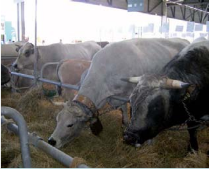
Animales de raza Bazadaise en exposición.

cas francesas y de otros países como España. Durante las conferencias de apertura de Aquitanima 2011, celebradas en el Consejo Regional de Aquitania, se destacó la importancia de esta región como productora vitivinícola y ganadera. Así mismo, se presentaron los dos objetivos fundamentales de la feria: