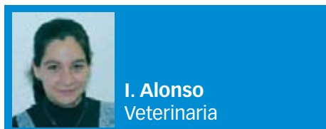
I. Alonso Veterinaria

Entre el 28 de mayo y el 2 de junio se celebró en la ciudad de Burdeos, la feria agroganadera más importante del sur de Francia, Aquitanima 2011, que reúne a los profesionales de la región de Aquitania. Este año, el salón vino marcado por el problema que está atravesando dicha región por una grave sequía; curiosamente la temática elegida meses atrás por la organización fue "El agua".