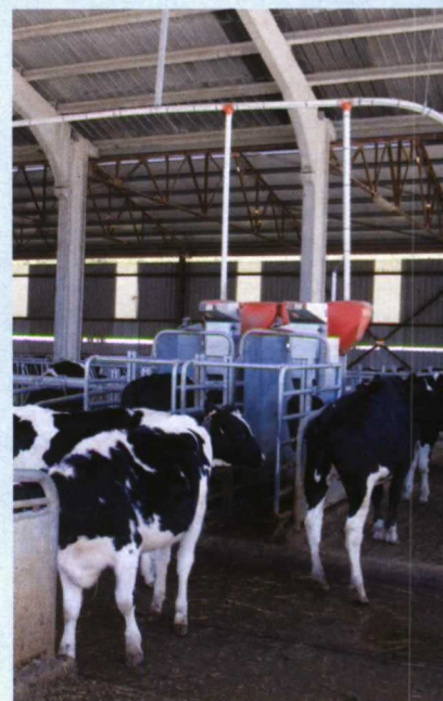
Foto 1. Pasillo de alimentación de vacas en ordeño. Foto 2. Parque de novillas. Fotos 3 y 4. Las vacas acuden solas al robot y pasan la mayor parte del tiempo tumbadas, rumiando tranquilamente. El cepillo Lely Luna también aporta confort. Foto 5. Las novillas aprenden a recibir el concentrado en las cabinas de alimentación Lely Cosmix.