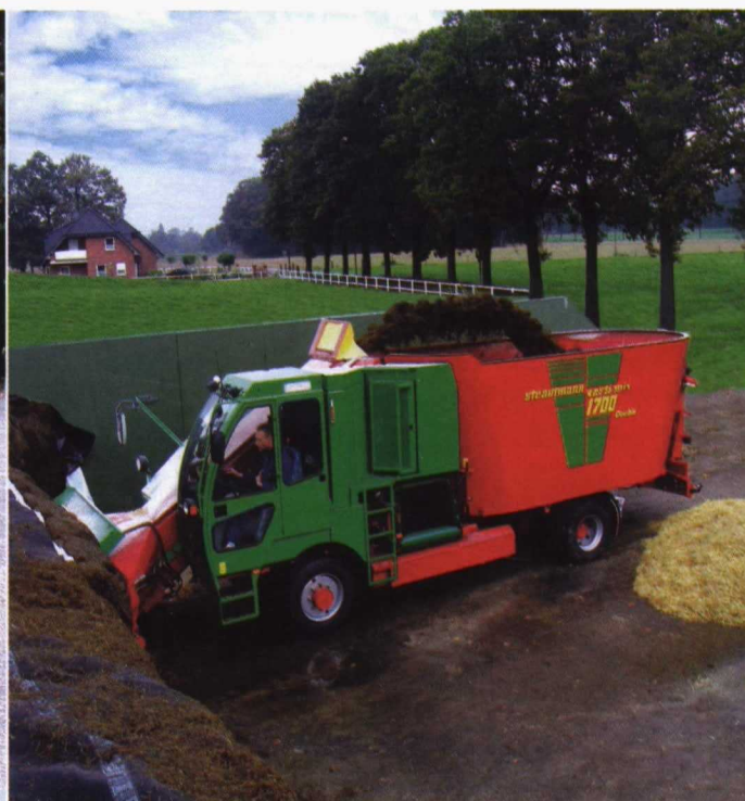
Foto 10. Cargador - mezclador - distribuidor autopropulsado.

“ Las rotoempacadoras, con una mecánica más sencilla, parecen una alternativa razonable en explotaciones medianas ”