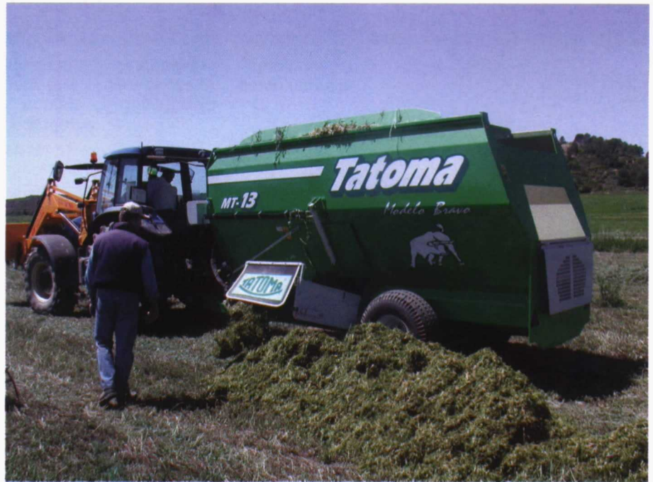
Foto 11. Mezclador - distribuidor con rotores horizontales.

Como última máquina a destacar hablaremos de los remolques autocargadores (Foto 8). Estas máquinas han experimentado un gran auge en el cultivo de la alfalfa debido a la importancia que el deshidratado industrial ha adquirido durante los últimos años, sin embargo su aplicación exclusiva para ser utilizados en explotaciones ganaderas en muchos casos no sería justificable. Se utilizan para la alimentación en verde del ganado y para transporte del forraje. Destacan por su alta capacidad de carga (entre >>