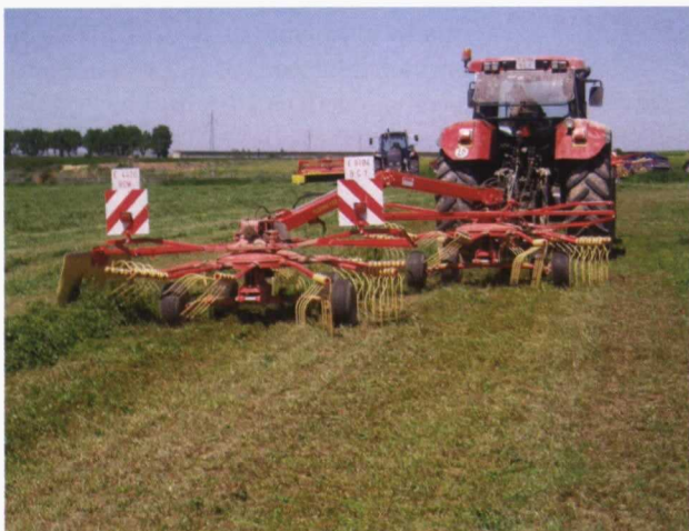
Foto 4. Rastrillo hilerador de ejes verticales.

secado del forraje, los sistemas de rodillos de goma (Foto 2) son menos agresivos que los sistemas de dedos (metálicos o plásticos, Foto 3). Los acondicionadores de dedos consumen más potencia que los de rodillos, con un incremento de consumo aproximado de 3kW por metro de anchura de trabajo. >>