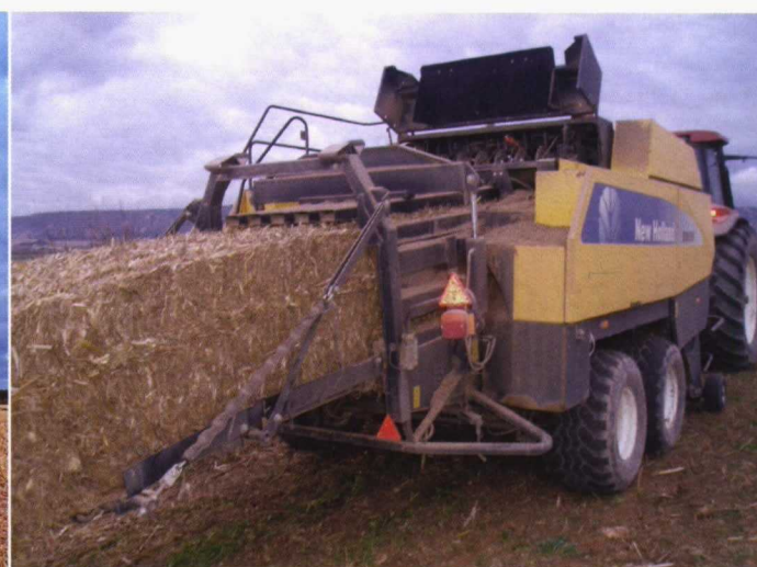
Foto 6. Macroempacadora de pacas prismáticas.