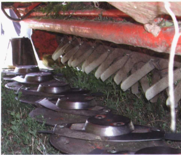
Foto 3. Segadora de discos con acondicionador de dedos de material plástico.

“ La recolección de forrajes se realiza con un conjunto de máquinas complementarias entre sí, configurando una cadena