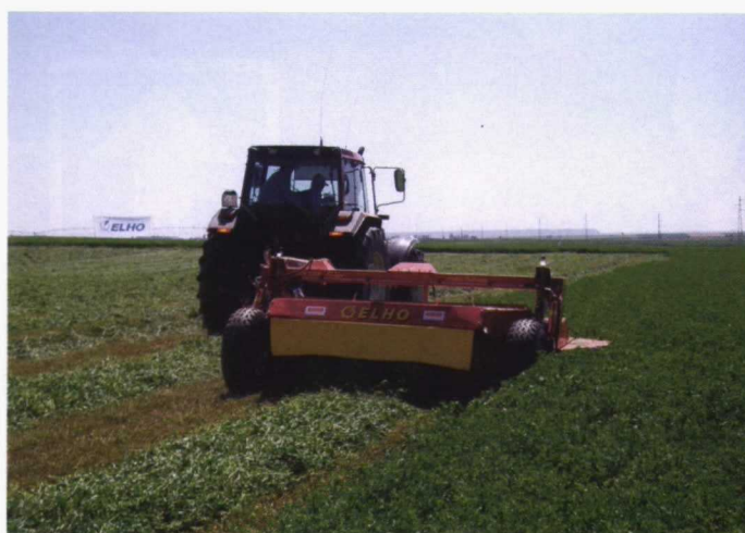
Foto 1. Segadora rotativa de discos en una parcela de alfalfa.

En cuanto a la elección del sistema de acondicionado incorporado a la segadora para acelerar y homogeneizar el