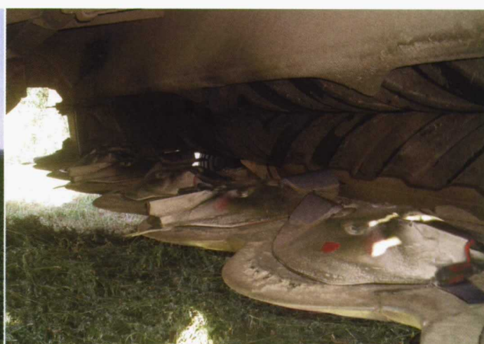
Foto 2. Segadora de discos con acondicionador de rodillos.