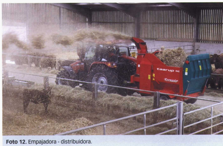
Foto 12. Empajadora - distribuidora.

10 y 16 t) y la posibilidad de incorporar sistemas de picado situados después del recogedor.