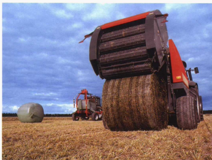
Foto 5. Rotoempacadora de cámara fija.