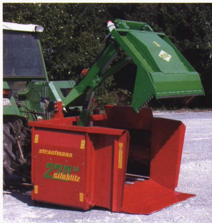
Foto 9. Cargador - distribuidor utilizado para desensilado y distribución.