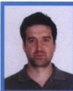
F. J. García Ramos Escuela Politécnica Superior de Huesca

Exceptuando la opción de que el forraje se destine a deshidratado industrial, las opciones que maneja el ganadero son el consumo en verde, la henificación y el ensilado.