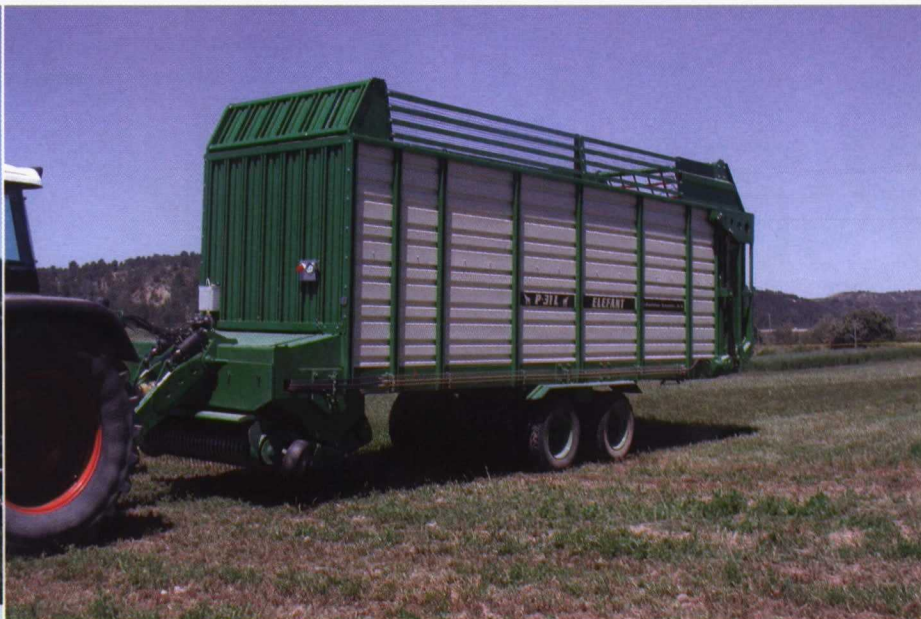
Foto 8. Remolque autocargador