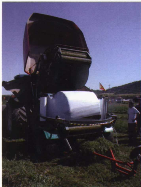
Foto 7. Encintadora incorporada a la cámara de una rotoempacadora.