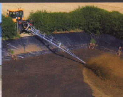
batidora de estiércol

Turbo = modelo básico Jumbo = versión especialmente robusta