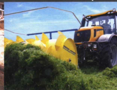
distribuidor de ensilaje

4 tipos básicos 3 diámetros de cilindro 18 anchuras de máquina