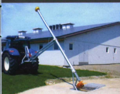
batidora de estiércol

¡Estiércol homogéneo de la primera a la última cuba para superiores beneficios! 1000 variantes