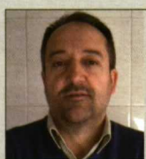
C. Fariñas DeLaval Equipos SA

La revolución industrial, a principios del siglo XIX, vaticinaba que los trabajos manuales y de rutina serían hechos por máquinas automáticas, como en efecto ocurrió. Pero esto sólo se aplicaba a los procesos industriales, donde el beneficio era percibido inmediatamente por los empresarios.