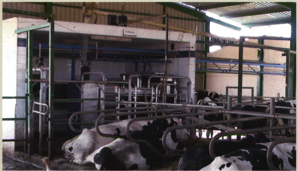
Ubicación del robot en la granja.

Se han realizado varios estudios en los que se trata de identificar los motivos por los que un ganadero invierte en un robot o en una sala de ordeño. En el Cuadro I se muestran los resultados de una de estas encuestas realizada en Holanda y en la Figura I los de un estudio del INRA francés.