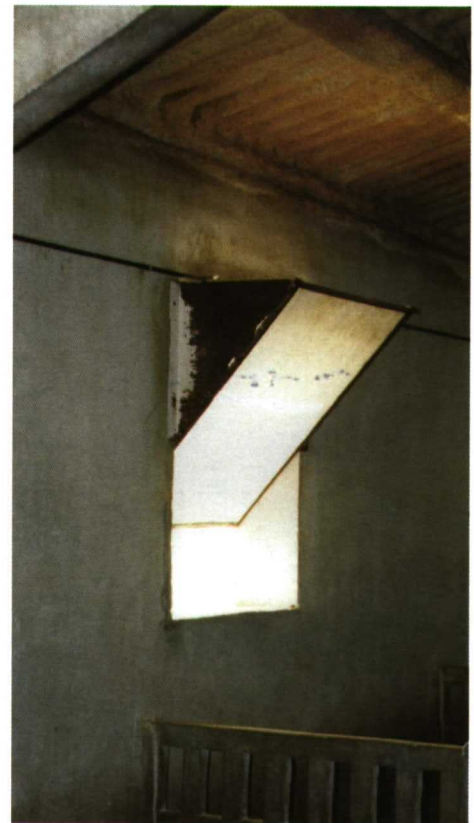
Foto 2. Deflector de aire acoplado a una ventana que no evita correctamente la presencia de una viga.

Una correcta inmunidad se puede favorecer también mediante el empleo de vacunas que deben ser elegidas y aplicadas estratégicamente en función de los patógenos más relevantes de la explotación.