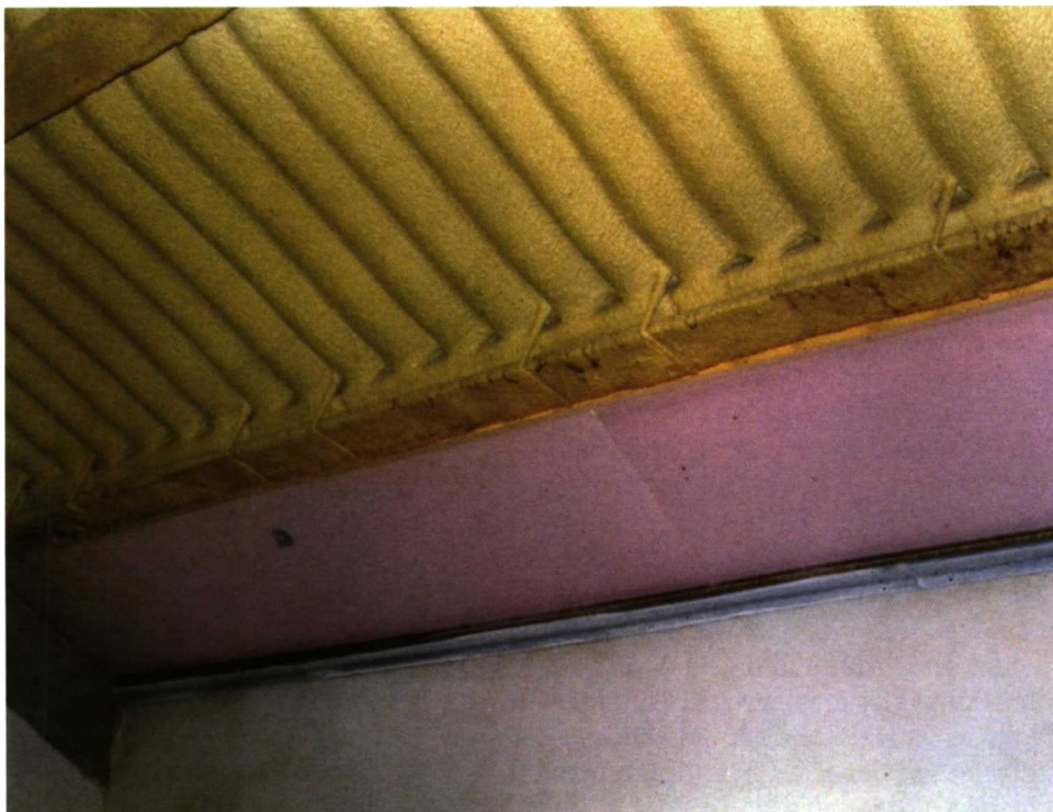
Foto 3. Sistema de deflección y de regulación de entrada de aire.