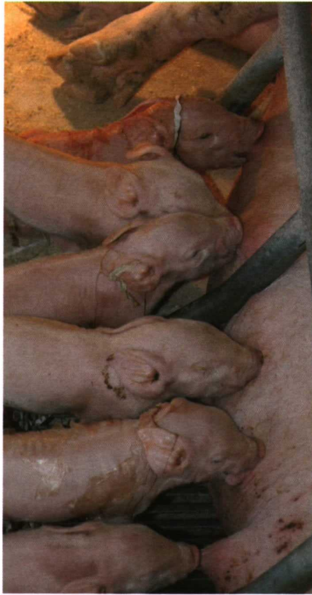
Foto 5. El encalostramiento correcto de los animales facilita el control del CRP.

El flujo de animales debe realizarse siempre siguiendo un sistema de todo dentro-todo fuera. Esto va a garantizar dos cosas: que no se producen mezclas de animales de distintas edades y con distinta situación inmunitaria; y que las salas se vacían, lo que permite una correcta limpieza y desinfección, lo que disminuirá la presión de infección y la