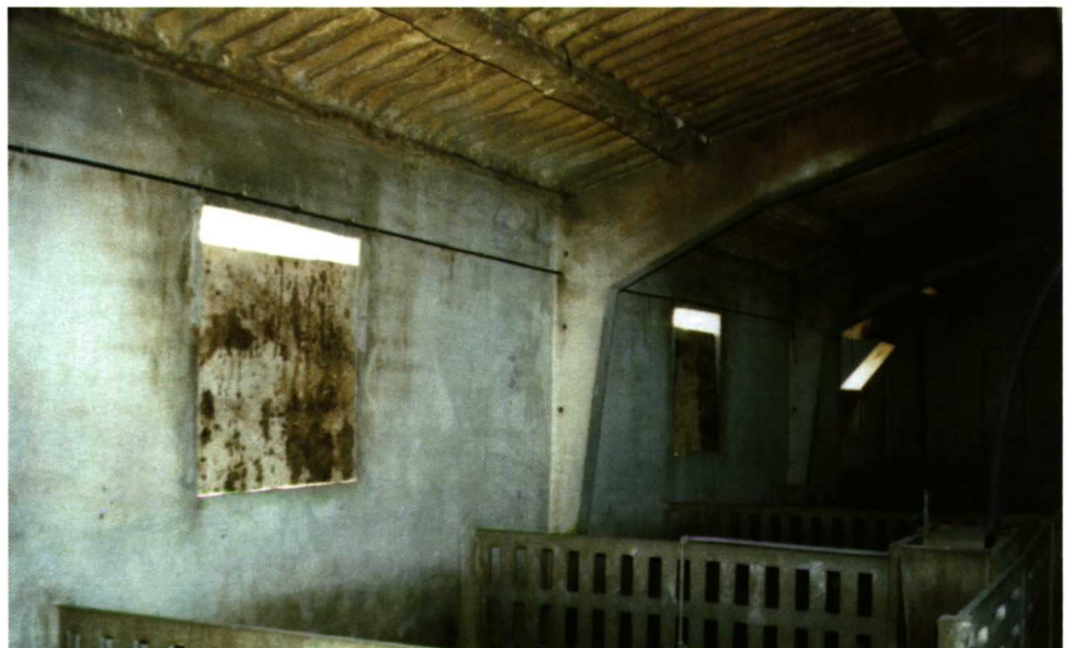
Foto 1. Presencia de vigas próximas a las entradas de aire que pueden causar corrientes de aire.

Los agentes patógenos determinantes de enfermedad implicados en el proceso pueden ser víricos o bacterianos. Entre los agentes víricos destacan el virus del Síndrome Reproductor y Respiratorio Porcino (VSRRP), el virus de la Gripe Porcina y el virus de la Enfermedad de Aujeszky. A estos virus se podría añadir, según estudios recientes, el Circovirus Porcino tipo 2, cuya presencia se determina con frecuencia en pulmones de animales que muestran distintos grados de neumonía. Entre los agentes bacterianos destacan por su relevancia Mycoplasma hyopneumoniae ( M. hyopneumoniae ) y Actinobacillus pleuropneumoniae . Ambos agentes tienen la capacidad de producir enfermedad por sí mismos y suelen estar presentes en casos