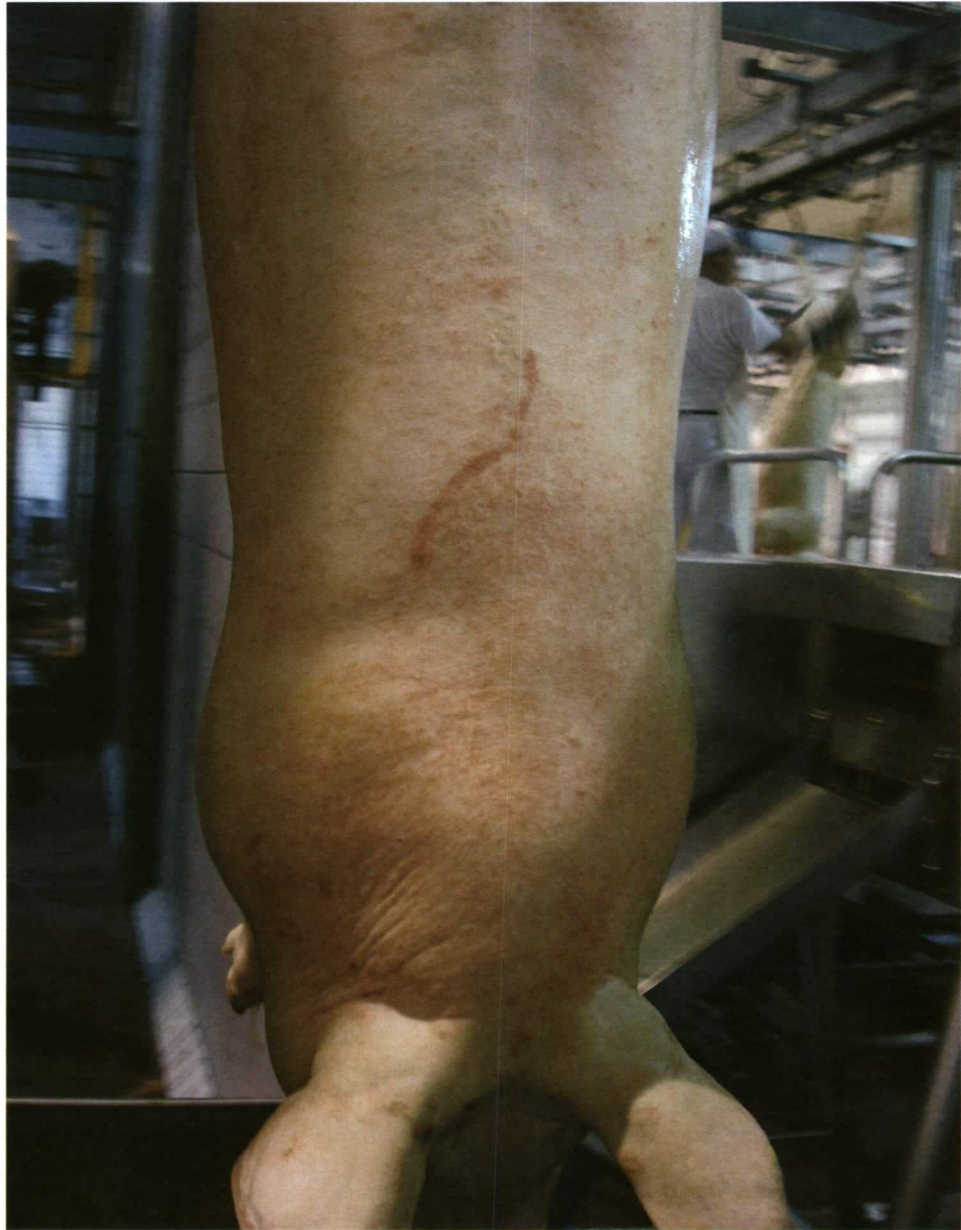
Foto 7. Cerdo con lesiones de dermatitis por Sarna de intensidad 2.