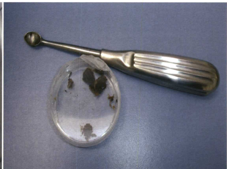
Foto 9. Cucharilla de Volkman.