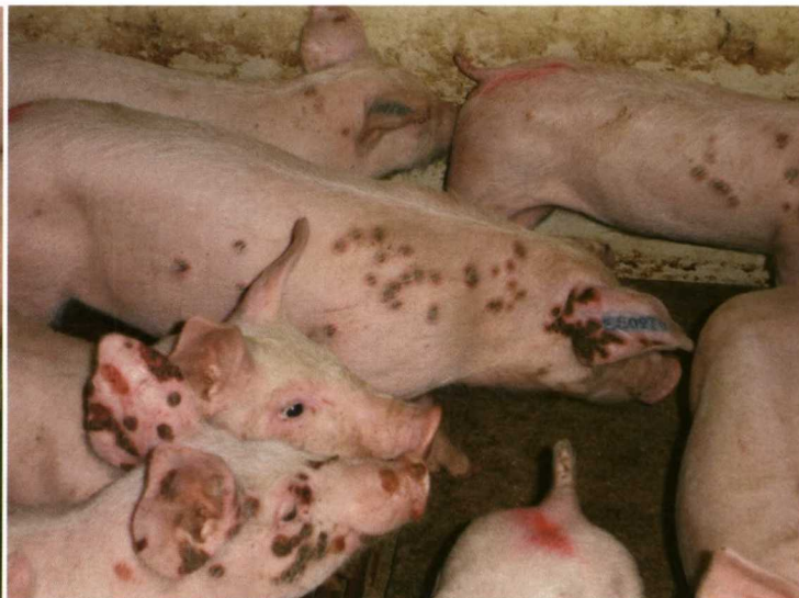
Foto 11. Cerdos afectados de Viruela Porcina.