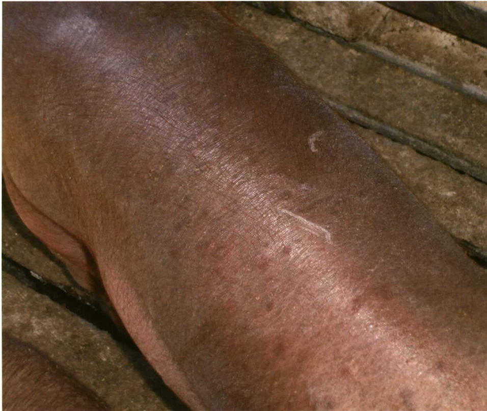
Foto 12. Cerdo picado por mosquitos.