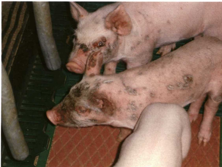
Foto 10. Cerdos afectados de Eczema Húmedo.