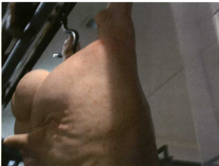
Foto 8. Cerdo con Sarna de grado 1.