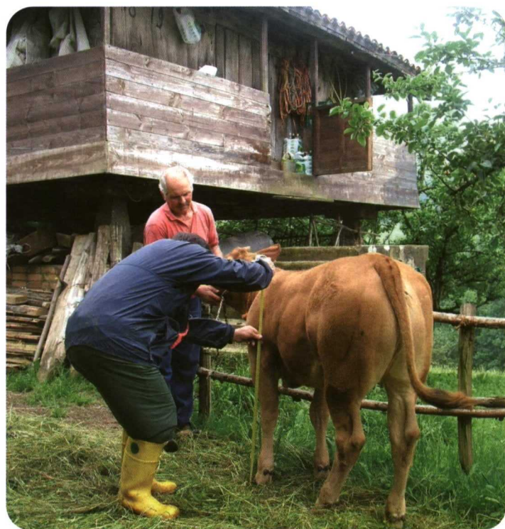
Foto 5. En el Control de Rendimientos se toman para cada parto datos productivos de la madre y su cría.