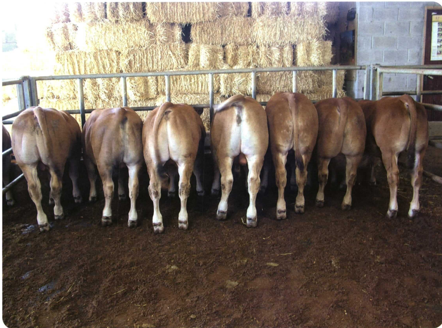
Foto 6. Los elevados rendimientos carniceros que proporciona la raza Asturiana de los Valles es una de sus principales virtudes.