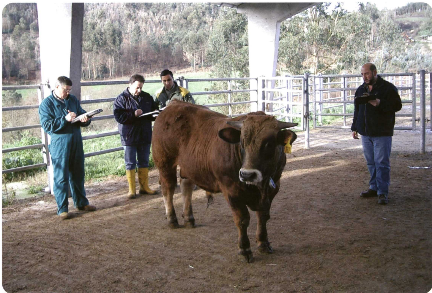
Foto 4. El acierto en la elección de futuros sementales es muy importante para la mejora y selección de la raza.

En raza pura, presenta un carácter muy apacible y resulta ideal para su cría en condiciones extensivas ya que se desenvuelve bien en terrenos accidentados y soporta perfectamente temperaturas extremas. Las vacas de esta raza son mansas, buenas madres, paren sin dificultad y destetan terneros de pesos elevados con buena conformación ( Cuadro I ).