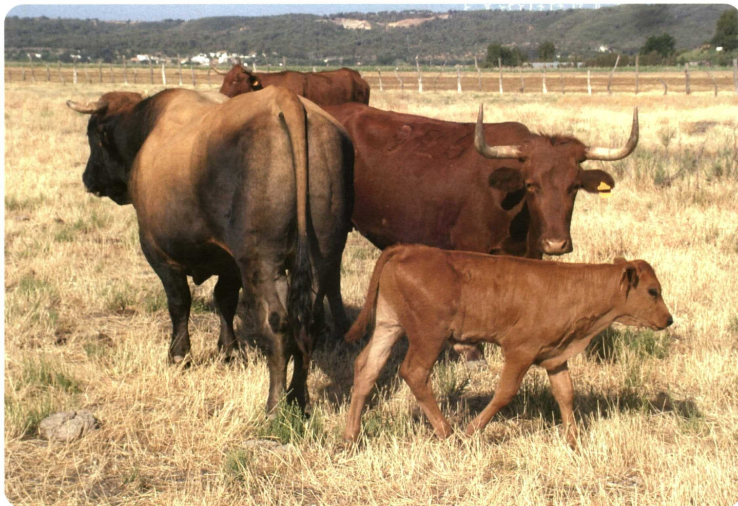
Foto 3. Cada vez es más frecuente ver toros de monta natural Asturianos en rebaños de vacas de cría de la España seca.