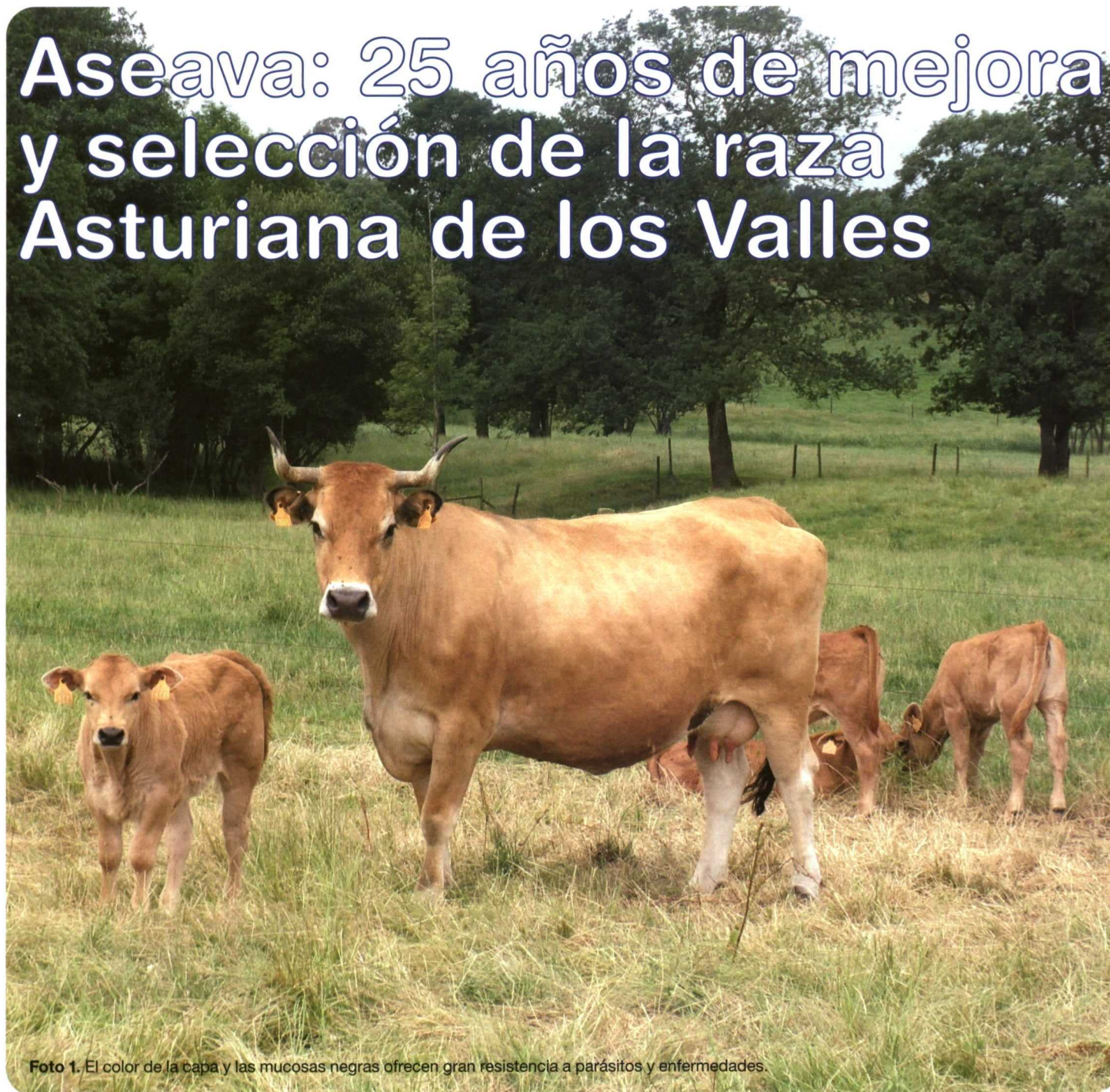
Foto 1. El color de la capa y las mucosas negras ofrecen gran resistencia a parásitos y enfermedades.