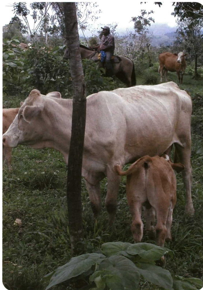
Foto 2. El cruzamiento de vacas cebuinas con toro Asturiano se está utilizando mucho en varios países americanos.

El Control de Rendimiento Cárnico consiste en la recogida de datos productivos de todas las reproductoras inscritas en el Libro Genealógico. Así, para cada ternero nacido se