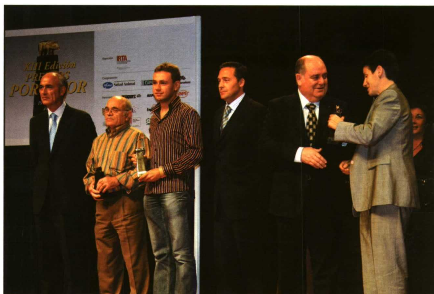
Premiados con el Porc D'Or, oro, plata y bronce en la 1ª categoría.

que la comparecencia de empresas ha pecado en esta edición de cierto localismo, que se prestaría a debate ante los desafíos del sector en los próximos años.