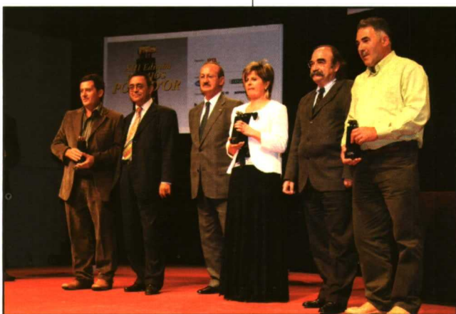
Arriba: Porc D'Or, oro, plata y bronce en la 2ª categoría.