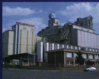
Vall Companys, S.A.

Esto nos permite obtener una información y un producto final con las garantías de calidad y producción exigidas por el mercado. Hacemos de la atención y servicio a los clientes nuestra auténtica vocación. Todo ello con un amplio equipo de profesionales, que ofrece un servicio de respuesta inmediata en caso de averías, con la posibilidad de un servicio permanente las 24 horas.