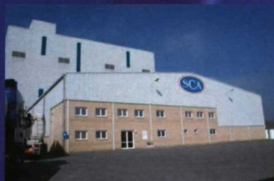
SCA Ibérica, S.A.

"AEmes", FABRICACIÓN DE PIENSOS, TRAZABILIDAD DIRECTA EN TIEMPO REAL, INCREMENTO PRODUCCIÓN Y CALIDAD TOTAL