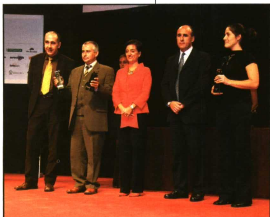
Derecha: Porc D'Or, oro, plata y bronce en la 5ª categoría.