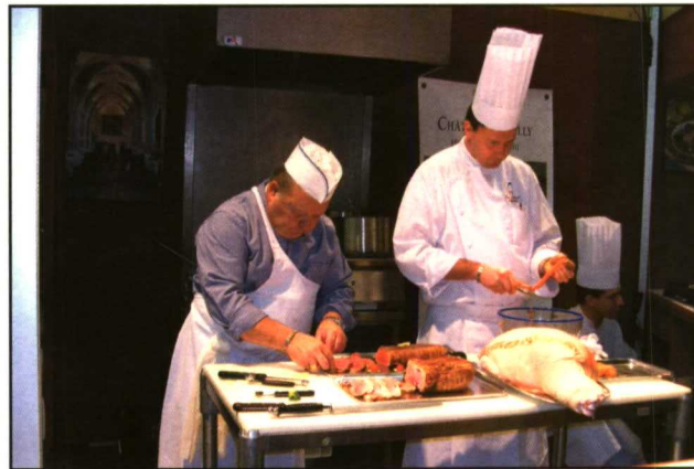
Las degustaciones gastronómicas también tuvieron cabida en el Sommet de l'Élevage.