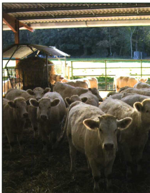
Cebadero de la región de Limousin.

La producción agraria y la industria agroalimentaria suponen cerca del 20% de los empleos en la región del Limousine.