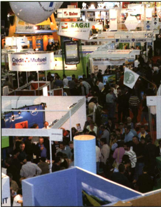
Panorámica de la exposición comercial.