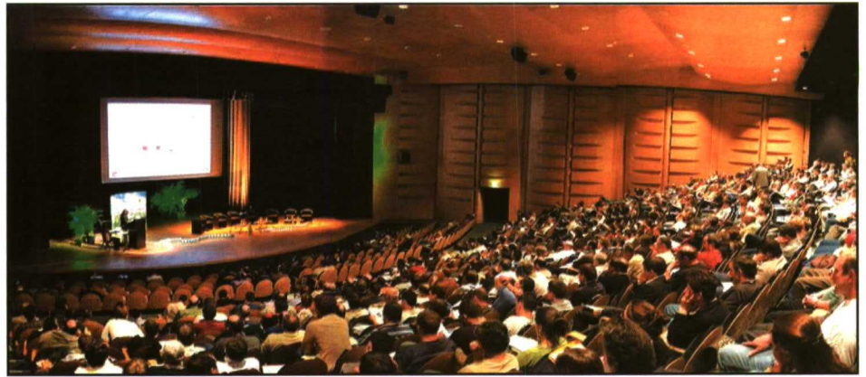
El coloquio de Interbev despertó un gran interés.