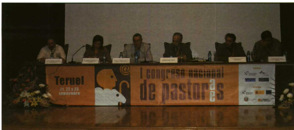
Mesa redonda "Sistemas de producción: Pros y contras de la ganadería intensiva y extensiva".