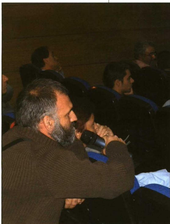
Las sesiones contaron con gran participación.