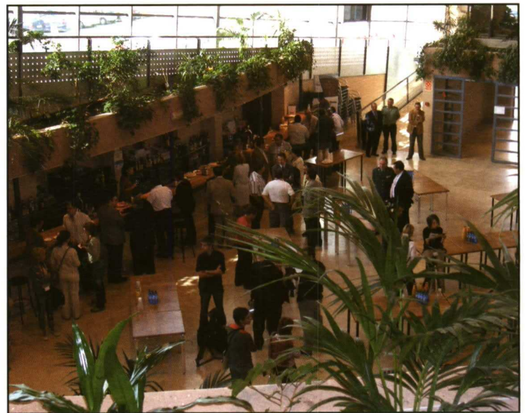
Imagen del interior del Palacio de Congresos de Teruel

lizados, técnicos, artesanos, representantes de asociaciones y cooperativas, así como de organismos públicos, entre otros. Este amplio abanico de puntos de vista favoreció la