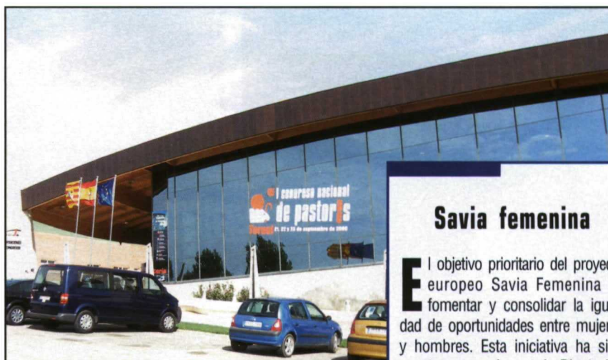
Las sesiones acapararon el interés de los asistentes