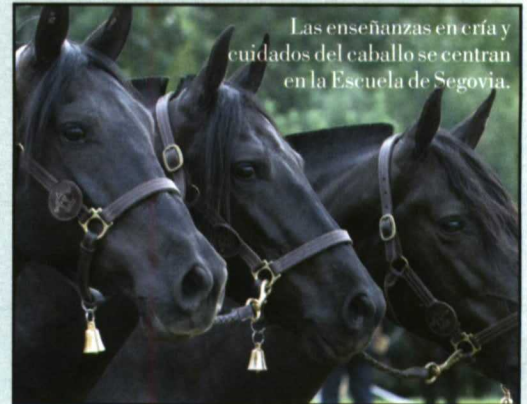
Las enseñanzas en cría y cuidados del caballo se centran en la Escuela de Segovia.

Se trata de una Escuela con explotación de vacuno de leche, ovino (churro), avicultura alternativa (faisán, gallinas ecológicas, etc.) animales de compañía (perros, gatos, peces, reptiles) y conejos. Un Arca de Noé donde la enseñanza práctica adquiere todo el peso. ●