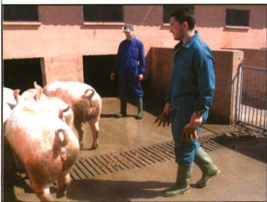
La formación práctica es el pilar fundamental en la explotación porcina de ciclo cerrado de Albillos (Burgos).

En los últimos tres años se vienen realizando en Castilla y León una media de 40 cursos de Incorporación a la Empresa Agraria con asistencia en torno a 700 alumnos anuales, de los cuales el 40% están relacionados con la ganadería.