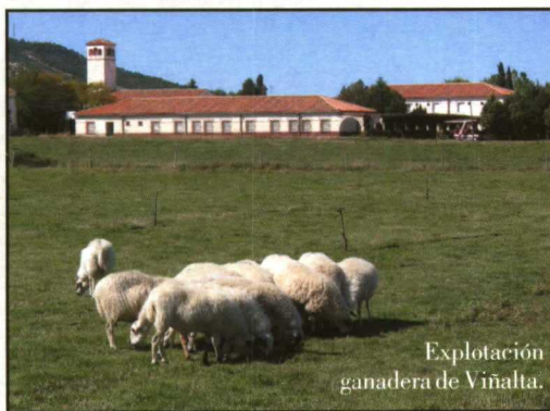
Explotación ganadera de Viñalta.

La Escuela cuenta con una moderna explotación agropecuaria representativa del tipo de explotaciones predominantes de la región y, en función de las enseñanzas impartidas, constituye el eje fundamental sobre el que se apoyan las enseñanzas