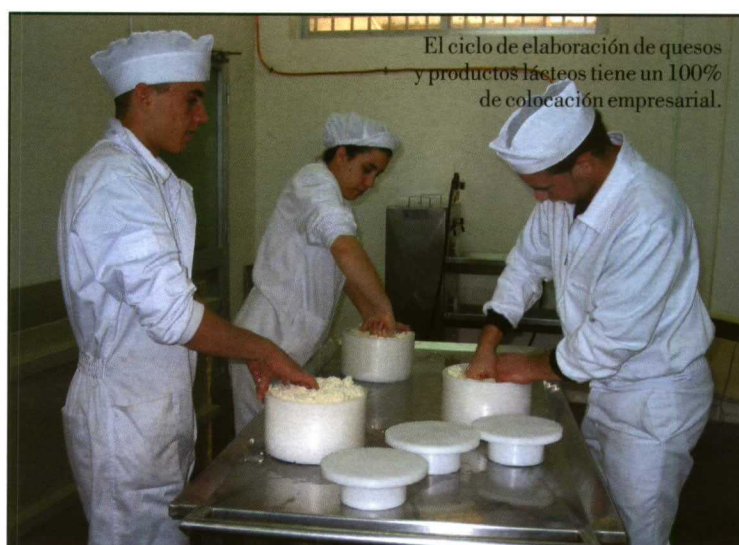
El ciclo de elaboración de quesos y productos lácteos tiene un 100% de colocación empresarial.