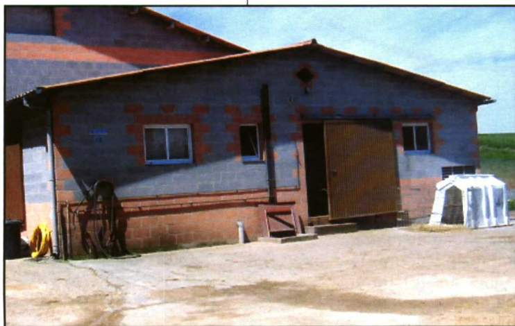
La sala de ordeño es de "espina de pescado".

Finalmente hay que resaltar el pequeño museo de aperos de labranza y herramientas antiguas que Faustino (padre) ha ido restaurando y arreglando con mucha paciencia y cariño. Se trata de útiles que se utilizaban antiguamente, tales como los carros del país tirados por vacas o bueyes, sembradoras manuales, arados, bombas manuales para elevar agua, etc. ●