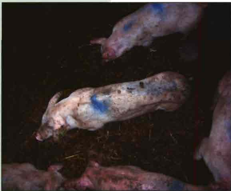
Figura 2. Cerdo con espina dorsal marcada y emaciación, al lado de una animal de aspecto normal en la misma corralina. Al cerdo con retraso en el crecimiento se le diagnosticó Circovirus Porcina mediante estudios histopatológicos y de detección de Circovirus Porcino tipo 2.

Ya que la CP es una enfermedad multifactorial en la que intervienen agentes infecciosos y otros factores no infecciosos, los esfuerzos para la prevención y control de esta enfermedad deben ir encaminados a controlar todos estos posibles factores.