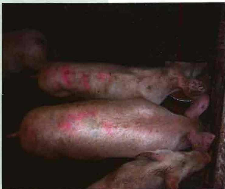
Figura 1.- Cerdo marcadamente retrasado en el crecimiento, con espina dorsal marcada y ostensible emaciación. Este aspecto clínico es potencialmente compatible con una Circovirus Porcina.

La enfermedad se ha observado en todo tipo de granjas (desde ciclo cerrado a producción en 3 fases) y de censos muy variables (de entre 30 y 10.000 cerdas). Suele afectar principalmente a cerdos de entre 2 y 4 meses de vida,