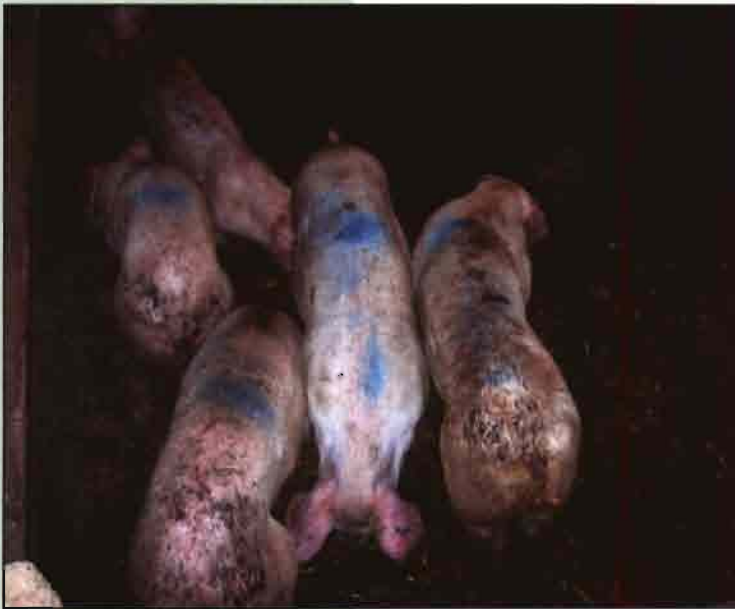
Figura 3. Grupo de animales de un lazareto con distintos grados de retraso en el crecimiento y emaciación. Cabe destacar que, aunque podrían tratarse de animales con Circovirus Porcina, ésta solo se puede establecer con los estudios laboratoriales pertinentes y no solamente con la observación clínica.

La bibliografía se encuentra en la redacción a disposición de los lectores.