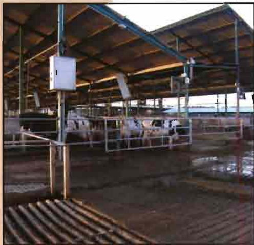
Diferentes vistas de los parques.