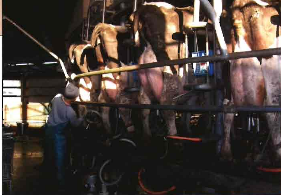
La sala de ordeño es de tipo "rotativa".

resultado de la labor de I+D de la propia Ganadería Priégola junto con instituciones de reconocido prestigio en el ámbito internacional. Se trata de un nuevo concepto que liga nutrición y salud, mediante el consumo de alimentos con efectos saludables. A los múltiples beneficios que producen estos alimentos funcionales (refuerzo del sistema inmunológico, regulación de la función intestinal, estímulo de la actividad intelectual...) por incluir en su composición diferentes probióticos (lactobacilos y bifidobacterias), prebióticos (fibra alimentaria) y ácidos grasos omega-3 ricos en DHA, cabe añadir que tienen como ventaja una vida mucho mayor, lo que facilita su conservación.