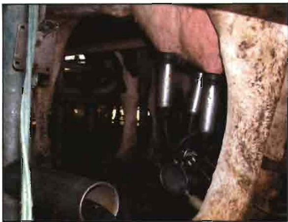
Las ubres se limpian a conciencia antes de colocar las pezoneras.