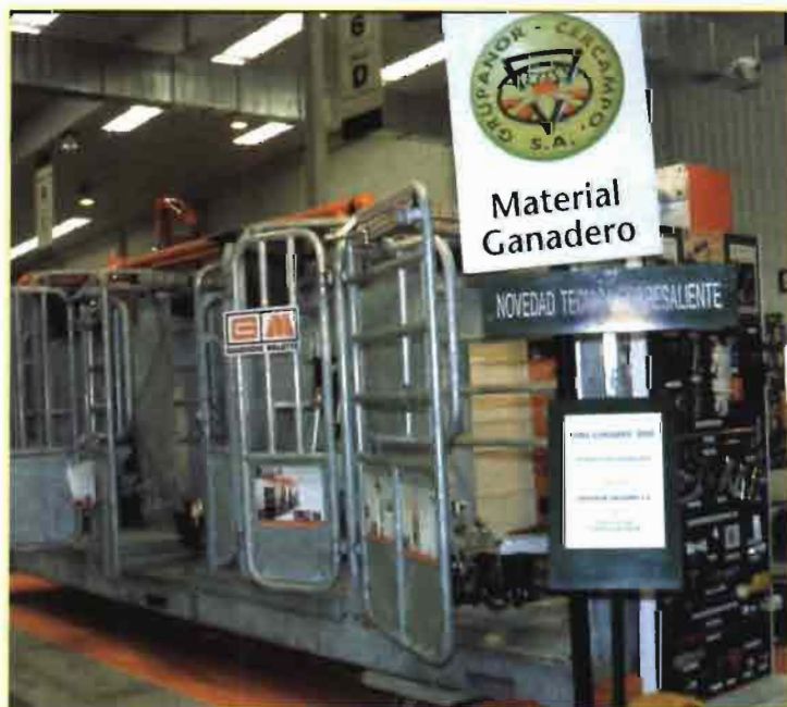
Los robots de ordeño se han presentado recientemente en las principales ferias del sector.

Dependiendo del sistema de ordeño y del tipo de conducta elegido (libre o forzada), las exigencias en cuanto al diseño de la explotación, superficies, sistema de barreras antirretorno... etc., son diferentes, y por lo tanto las inversiones variarán notablemente. En el caso más desfavorable el coste de adecuación de las instalaciones o construcción de un sistema multibox ascendería a unas 1.650.000 ptas.; esta cantidad se reduciría considerablemente para el sistema monobox.