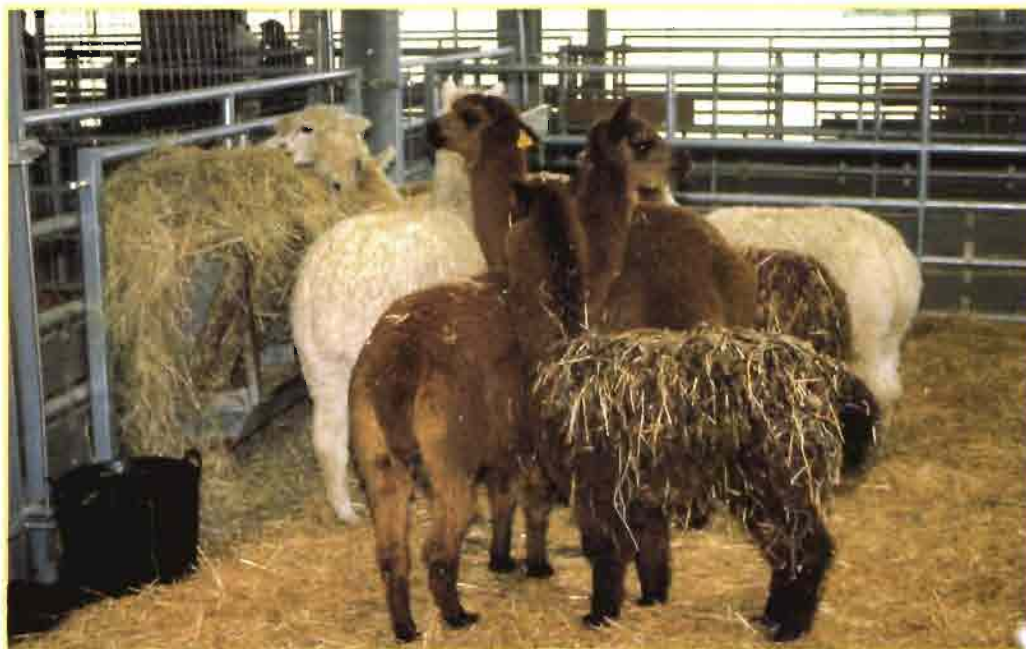
Llamas en la exposición ganadera de Colmenar (Madrid).

Los sistemas de producción son muy variados, desde los extensivos rudimentarios al aire libre a la cría controlada en naves e instalaciones climatizadas. Las nuevas explotaciones están preparadas con sistemas de riego, vegetación y otras condiciones que garantizan la humedad suficiente para que los animales crezcan adecuadamente.