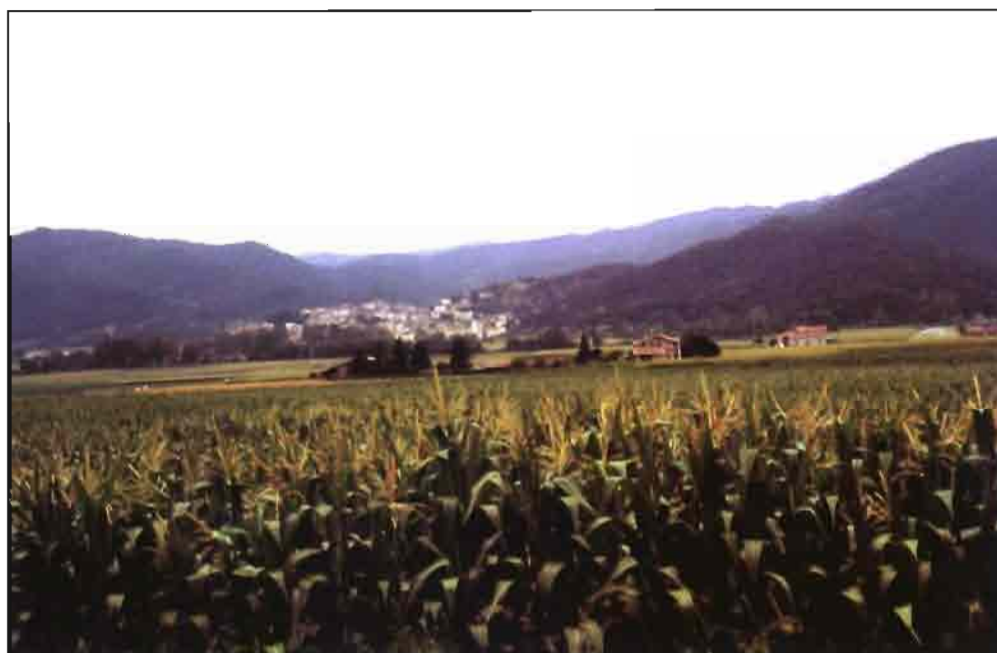
El maíz para ensilar se puede aprovechar en distintos estados vegetativos.

En el presente estudio pretendemos analizar cuál ha de ser el estado fisiológico de la planta de maíz en el momento de segarla cuando lo queremos aprovechar como forraje y la valoración económicamente más coherente, según el estado y el producto que se obtiene. Este estudio es interesante, además de para los ganaderos que compran maíz para ensilar, especialmente para los agricultores que venden y no saben cómo valorarlo.