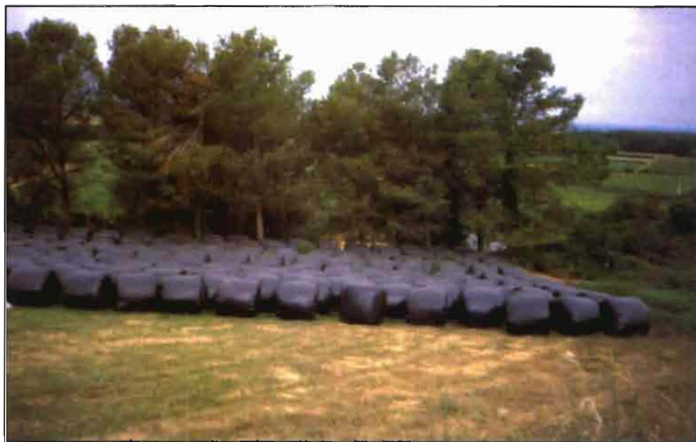
En caso de necesidad el maíz se puede ensilar por otros métodos.

en el campo, pagándolo al precio real que tendría en el mercado en el momento de la recolección.