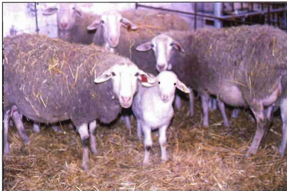
El tratamiento con implantes de melatonina es una nueva posibilidad en el control de la reproducción.

Los mecanismos por los que el fotoperiodo regula la actividad reproductiva en el ganado ovino son complejos y van más allá del concepto tradicional del papel estimulador de los días cortos o decrecientes y del papel inhibitor de los días largos o crecientes. De este modo, cuando las ovejas son mantenidas a un régimen cons-