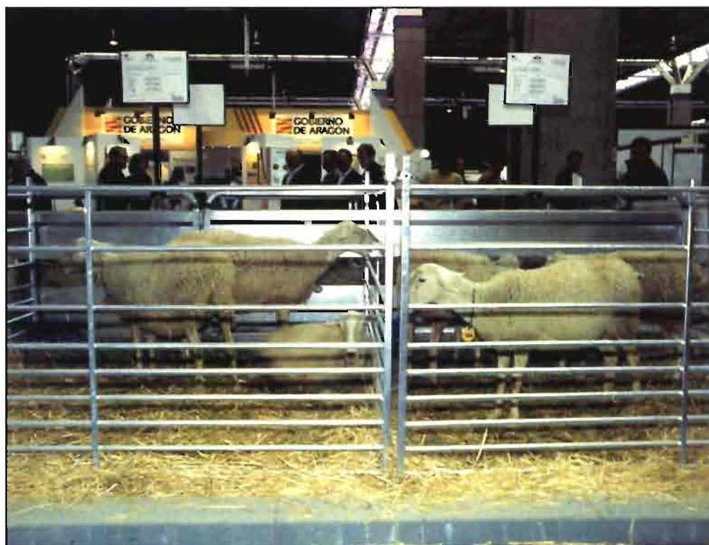
En 1999 se creó Oviaragón, sociedad cooperativa que se debe convertir en el nuevo motor del sector.

con un buen número de explotaciones ganaderas extensivas que se han visto gravemente afectadas por la sequía, la cual ha obligado a elevar de forma considerable los costes de alimentación. De forma similar al aumento de gastos que ha supuesto la subida del gasóleo para las explotaciones intensivas.