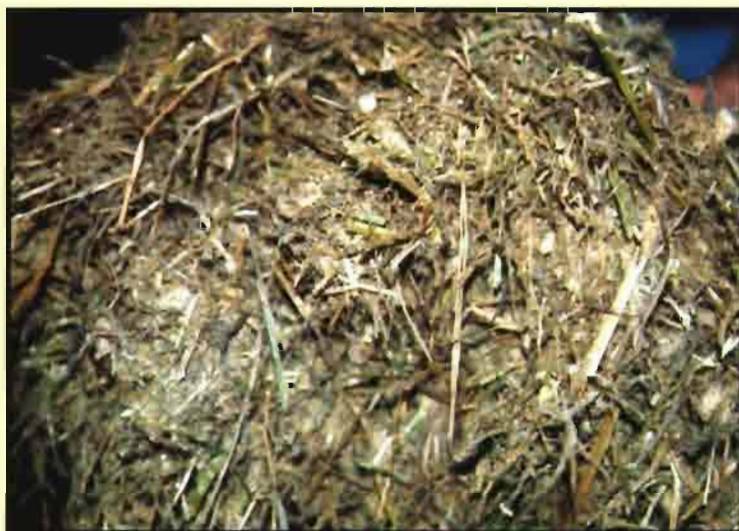
La ración debe estar bien equilibrada para evitar las mamitis.

Los cubículos se deben arreglar diariamente para igualarlos y añadir paja cuando estén bajos (debemos recordar que hay un consumo de paja por parte de