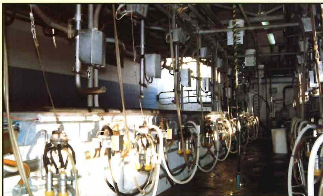
El funcionamiento de la sala de ordeño debe ser perfecto para evitar agresiones a la ubre.