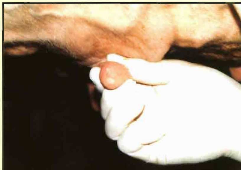
Limpieza individual de los esfínteres de los pezones.