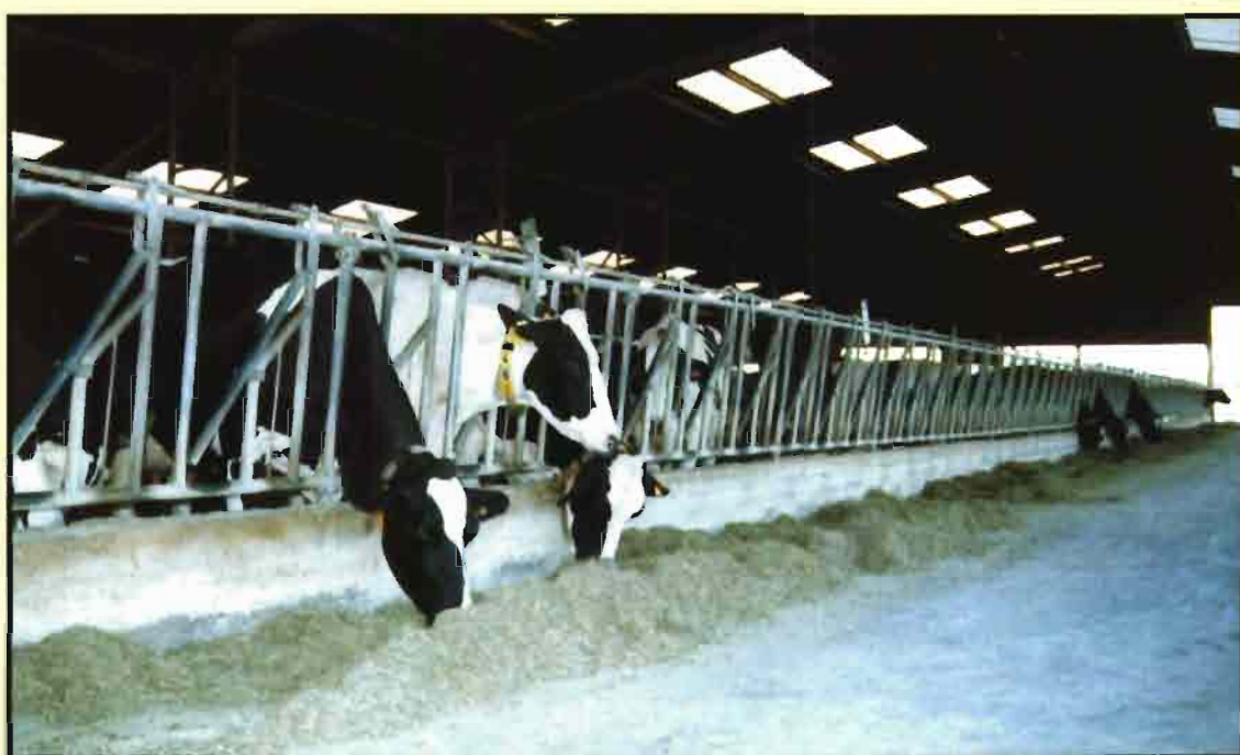
La explotación de la SAT Arronte centra su prevención de la mamitis principalmente en cuatro puntos.

Una vez conseguidas estas materias primas, se elabora una ración que esté bien equilibrada, ya que cuando hay grandes desajustes, sobre todo si hay una