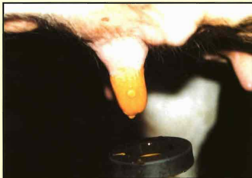
Sellado de pezones mediante vaso aplicador.