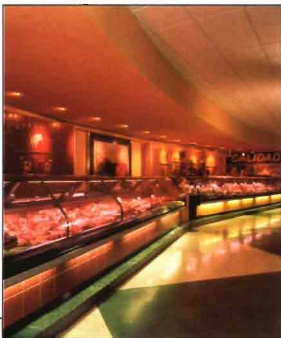
El consumidor busca, cada vez más, establecer un equilibrio entre salud y alimentación. En la foto de la izquierda el laboratorio de la ENAC.

los sistemas que regulen la libre circulación de los productos en todo el mercado interior, que den un valor añadido. En 1992, la Unión Europea crea un sistema de protección de los productos tradicionales elaborados dentro de la variedad de regiones existentes en su interior, para, así, dar respuesta a las exigencias de los consumidores europeos en relación con su interés por el origen de los productos y por su modo de producción tradicional.