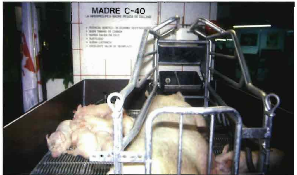
La selección porcina ha llevado a la obtención de líneas genéticas más prolíficas.

El programa alimenticio a seguir depende del peso a la entrada en la granja de reproducción. Si la llegada es alrededor de los 90 kg. de peso vivo, con aproximadamente 160 días de edad, el