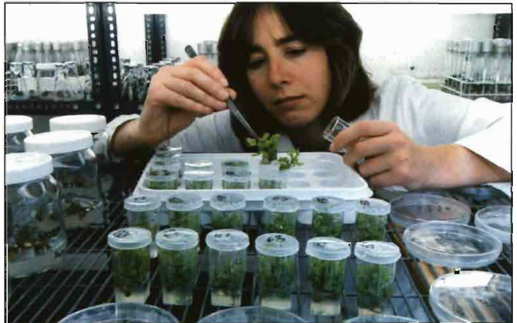
Los genetistas tienen las herramientas para mejorar las características de los cereales y leguminosas.

-Retrocruzamiento: una técnica tradicional usada para eliminar una característica genética no deseable de una planta híbrida desarrollada recientemente. La planta híbrida se cruza con una planta estrechamente relacionada con ella que no tiene la característica no deseable, con el