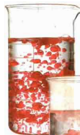
Una demostración del efecto inmediato de Bredol sobre grasas en agua. Arriba sin Bredol.