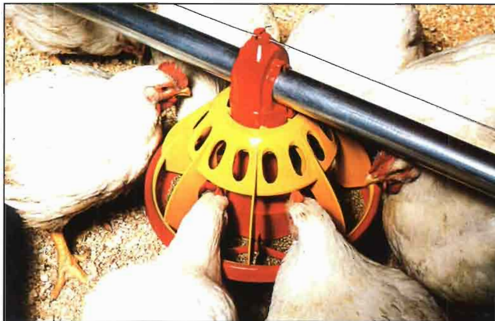
Las ventajas de la biotecnología para la producción de piensos en avicultura será evidente.