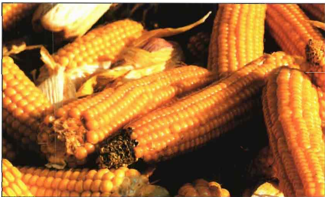
Nuevos cultivares de maíz facilitarán la formulación de los piensos.

El efecto de la alimentación con HOC sobre la composición de la canal de las aves depende del tipo de grasa, cantidad de grasa y nivel de HOC en la dieta (Araba, 1997). Existe la posibilidad de que el porcentaje de ácido linoleico en la grasa de la canal pueda aumentar (los datos muestran que el cambio no es significativo), porque las dietas con HOC contie-