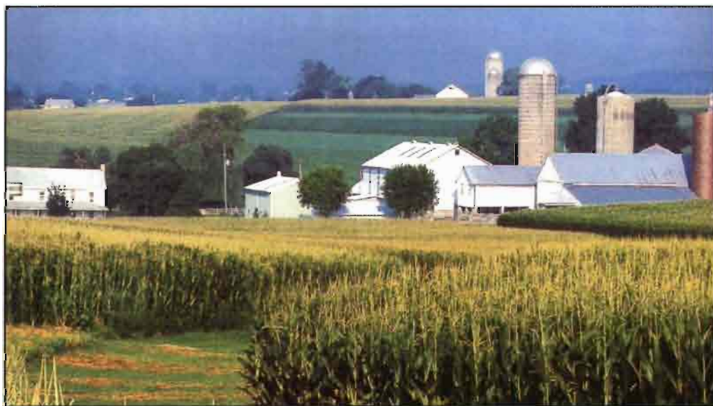
Diversos organismos de Estados Unidos regulan los aspectos relacionados con la biotecnología.

Las características de calidad o valor añadido van a ser concentradas con el fin de reducir el coste de infraestructura por característica para mantener la preservación de identidad del alimento.