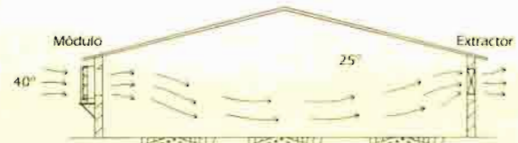
Esquema instalación módulos depresión

Además de este modelo de 15.000 m 3 /h. hay otro con boca plana especial para granjas de ponedoras, con poca altura por encima de las jaulas y otros dos modelos con caudales de 8.000 y 11.000 m 3 /h. también regulables electrónicamente.