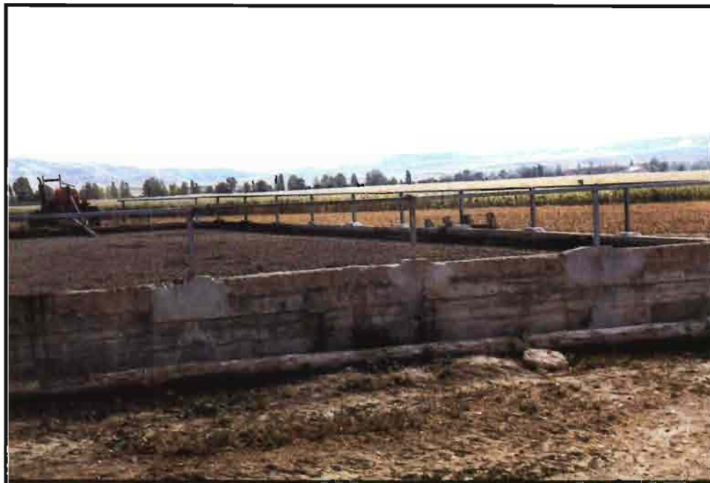
El metro cúbico de purín presenta un valor económico de 1.000 a 1.200 pesetas como fertilizante.

– La aplicación supuestamente agrícola "me da lo mismo", en la que el ganadero busca un lugar donde poder colocar los estiércoles o los purines durante un tiempo más o menos largo a la espera