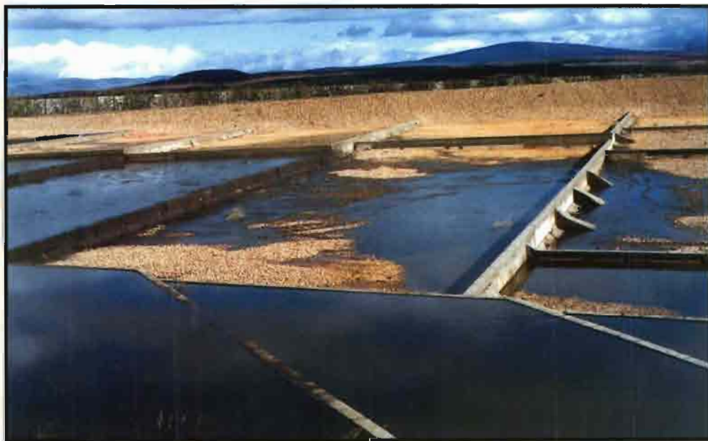
La reducción de la producción de residuos tiene que ser objetivo prioritario de la explotación pecuaria.

El incremento de la capacidad productiva en la mayoría de las explotaciones ganaderas ha generado una mayor producción de subproductos que se deben gestionar y, sobre todo, almacenar. El mal uso de algunos subproductos a los que no se les ha dado el valor que poseen es otro factor que influye en la percepción de la problemática de la gestión. Un tercer