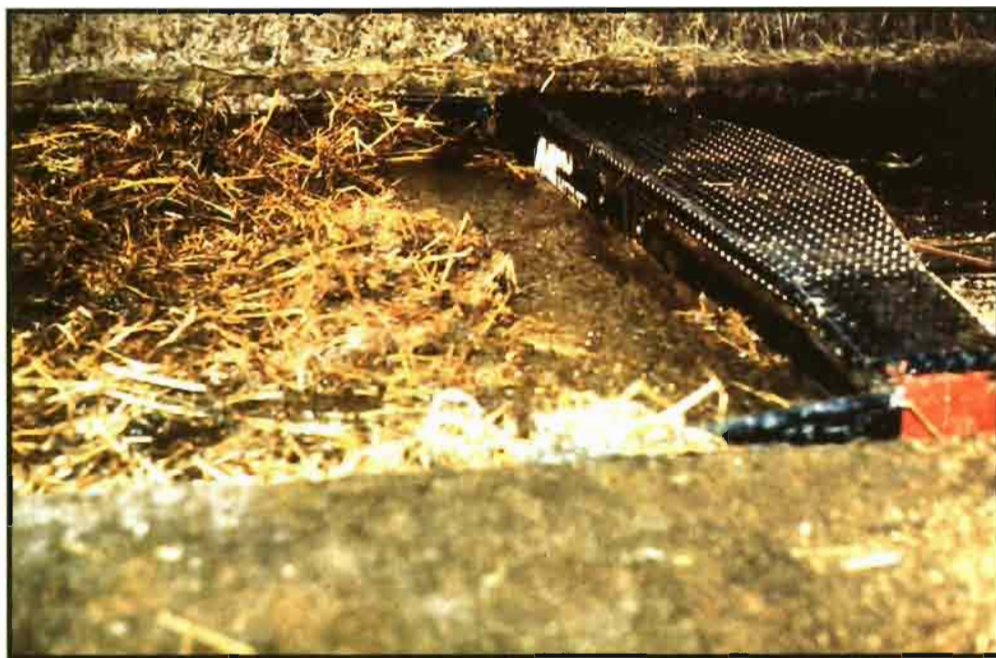
Existe un buen número de sistemas de limpieza de los corrales.

Los desagües de aguas pluviales. Aún hoy nos encontramos con muchas granjas que tienen conectado todo el sistema de