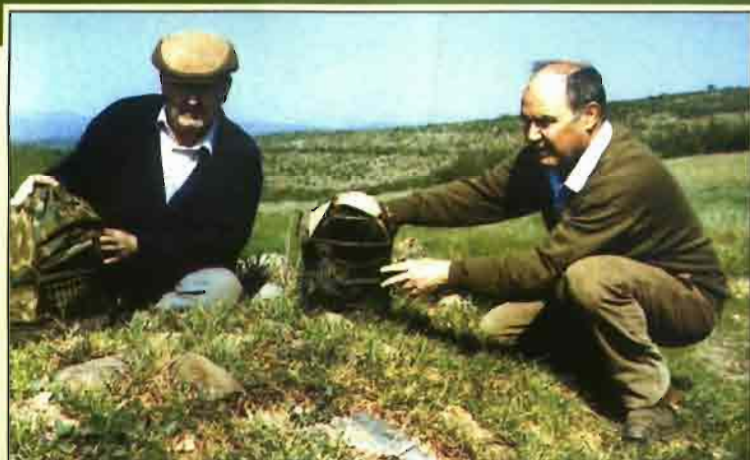
Algunos perdigoneros podrán seguir «colgando el pájaro» hasta finales de mes.

Cuando se redactaban estas líneas, estaba a punto de publicarse en el B. O. de Extremadura —o sea, que va en serio— una ley que eleva hasta el absurdo los impuestos cinegéticos para los cotos de caza. ¿Saben cuándo va a tener que pagar el propietario o titular de un coto de 1.000 ha cercadas a la Junta de Extremadura? Un millón y medio de pesetas, sólo en impuestos. A esto hay que sumar los guardas, el mantenimiento de la finca... Lo han subido un cien por cien con respecto a los que había, los más caros de España.