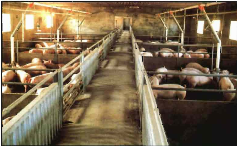
El Marco Nacional se aplicará en las 17 comunidades autónomas.

El denominado Marco Nacional de Actuaciones para la lucha contra la Peste Porcina Clásica se aplicará en las 17 comunidades autónomas y divide el territorio en cuatro zonas o anillos. La primera está formada por las 21 comarcas afectadas o zonas de seguridad, donde se realizarán los análisis serológicos para la detección de las enfermedades en todas las explotaciones, mediante la técnica del muestreo en cerdos que se mantienen en grupo o de animales criados individualmente.