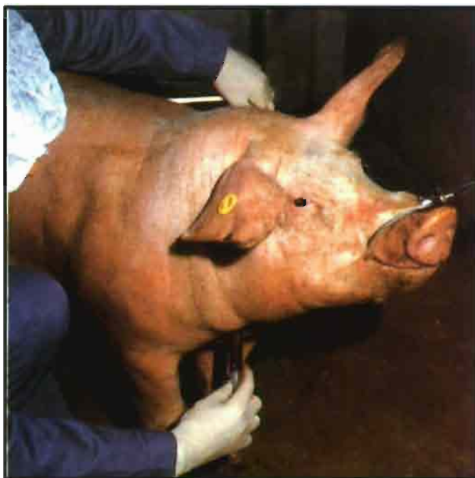
Las muestras de sangre se conservarán en refrigeración.

• Se desinfectarán el perímetro de la granja cada 4 ó 5 días según la proximidad