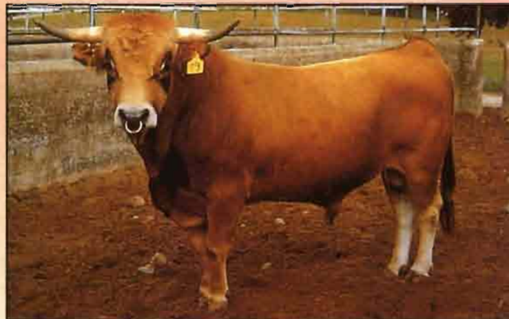
A la izquierda Dandi, toro probado de la raza Asturiana de los Valles. A su lado, Celador, semental del catálogo de la raza Asturiana de la Montaña.