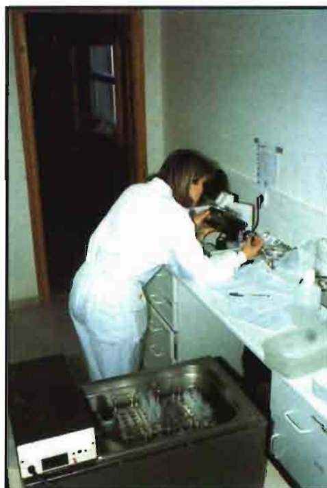
Laboratorio para inseminación artificial.

Para la introducción del semen en el tracto genital femenino se utiliza un catéter curvado en su extremo anterior que se puede obtener de catéteres de inseminación en especies mayores (vacas, yeguas...) y cuyas dimensiones oscilan entre: