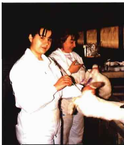
España se ha incorporado a la I.A. cunícola.

- Control de enfermedades transmisibles por vía genital debido a la falta de contacto entre machos y hembras.