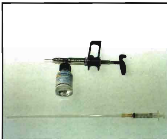
Pipeta para inseminación.

También hay que señalar que los tratamientos repetidos