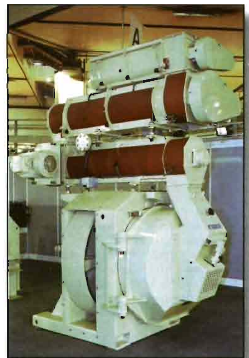
Granuladora DPAS con doble acondicionador.