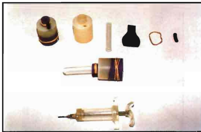
Vagina artificial para inseminación artificial.

El principal inconveniente para la utilización de la congelación en I.A. en cunicultura es la ausencia en el mercado de un diluyente capaz de mantener la vitali-