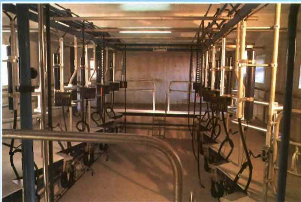
Ganadería Adellina. Bruil-Castropol (Asturias).