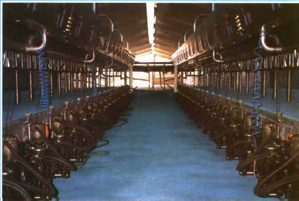
Unión Montaribe. Cortes (Navarra).

● Identificación automática en la sala de ordeño.