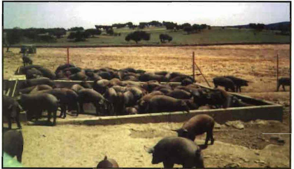
Los ganaderos e industriales del Ibérico han tenido una gran temporada.

hasta alcanzar valores en consonancia con los precios del gordo, con una caída del 50% del precio del lechón.