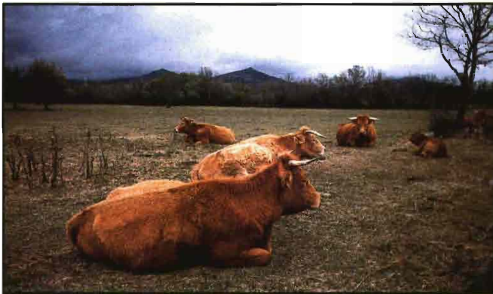
La alimentación de las vacas de carne se basa en el consumo de los pastos naturales.

Decidir que toro vamos a utilizar en el rebaño es de gran importancia en primer