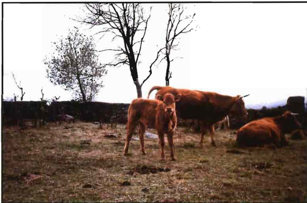
El objetivo ideal en una explotación vacuna extensiva es conseguir un ternero por vaca y año.

El estado óptimo del aparato reproductor de las vacas es fundamental para la rentabilidad de la explotación. De un 30 a un 40% de las vacas que se desechan en las explotaciones se producen por causa de la infertilidad (Berchtold, 1988).