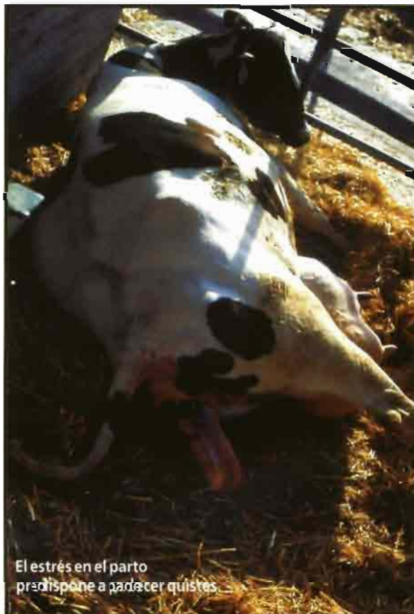
El estrés en el parto predispone a padecer quistes