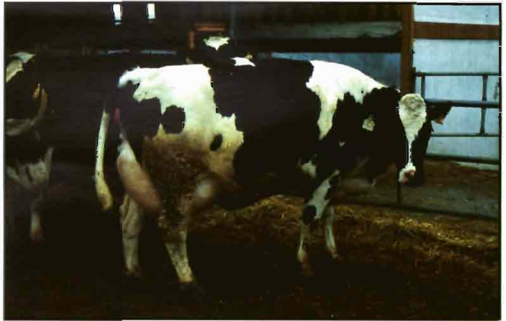
Entre un 10/13% de las vacas desarrollan quistes ováricos durante el postparto.